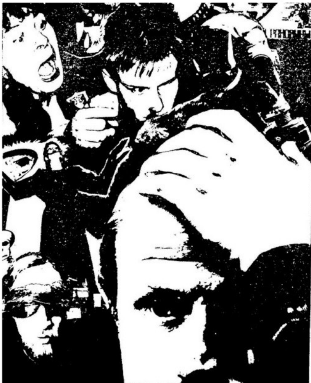
Фрагмент одной из публикаций