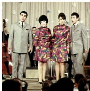
Вокальный квартет «Аккорд» (1957—1988)