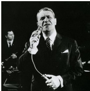
Марк Бернес (1911—1969)

Имя этого певца стало легендой, а песни в его исполнении стали народными. Сам себя он считал киноактером. Но в нашей памяти он остается, прежде всего, исполнителем проникновенных душевных песен, каждая из которых – своеобразная новелла о жизни поколения, победившего в войне и вернувшегося к мирной жизни.