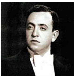
Михаил Александрович (1914—2002)

Голос этого певца ассоциируется прежде всего с предвоенным временем. В начале 1950-х этот голос чуть ли не ежедневно звучал по радио и неизменно на танцплощадках, когда пары еще степенно двигались под романтические мелодии, звучащие с грампластинок. С записями песен в исполнении этого певца в Советском Союзе тогда было выпущено семьдесят пластинок общим тиражом два миллиона экземпляров. А на его концертах был неизменный аншлаг, потому что многим хотелось не только услышать, но и увидеть своими глазами на сцене Михаила Александровича.