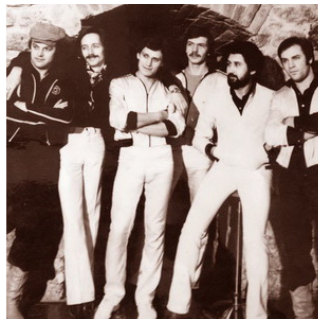
ВИА «Аракс» (1971—1982)

Про группу «Аракс» вполне уместно сказать, что люди «слышали ее гораздо чаще, нежели можно было себе представить». Этот коллектив «стартовал» в самом начале 1970-х годов, выступал на подпольных концертах и танцплощадках, работал в театре и записывался со многими известными исполнителями – причем, как правило, анонимно.