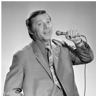
Олег Анофриев (1930—2018)

Этот человек отличался большим талантом и многогранностью его реализации. Он играл в театре и в кино, пел с эстрады, был ведущим теле- и радиопрограмм, озвучивал мультфильмы. В кино его голосом пели Ширвинд и Абдудов, Носик и Куравлев. Он писал стихи и прозу, сочинил больше пятидесяти песен, многие из которых и сегодня звучат по радио, телевидению, с киноэкрана.