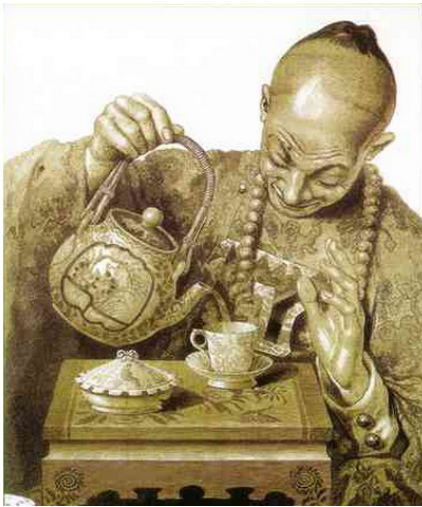
Китайская гравюра XVIII века

занных торговым судоходством с портами Южного Китая, Испании, Германии, Англии, усвоили фонетические формы (соответственно — te, tee, tea ), которые близки южнокитайскому произношению.