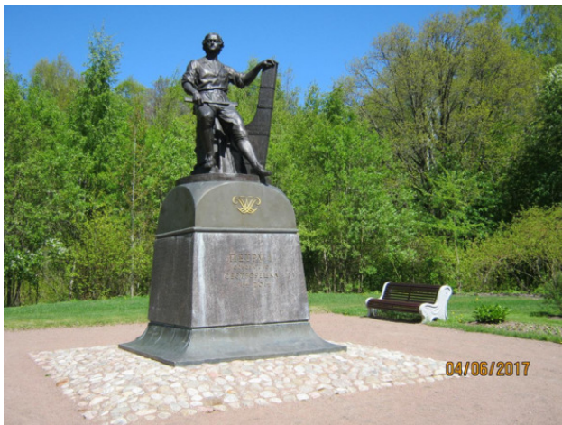
Памятник Петру I в парке «Дальние Дубки»