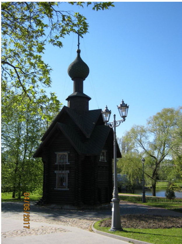
Вид часовни с юго-востока

Здесь же, рядом, возвышается и храм в честь Святых Апостолов Петра и Павла. На территории храма установлены памятные доски со скорбным списком затонувших подвод-