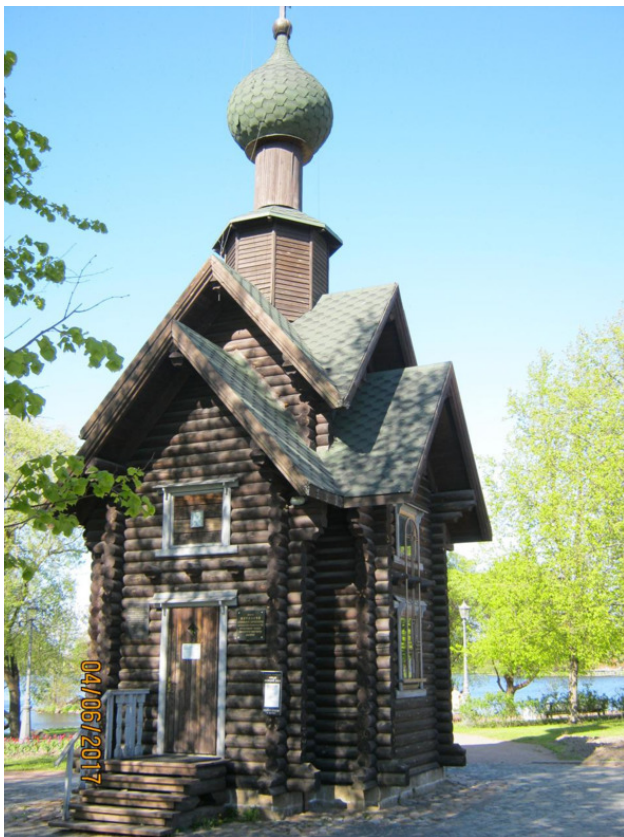
Часовня Святителя Николая Чудотворца (вид с юго-запада)