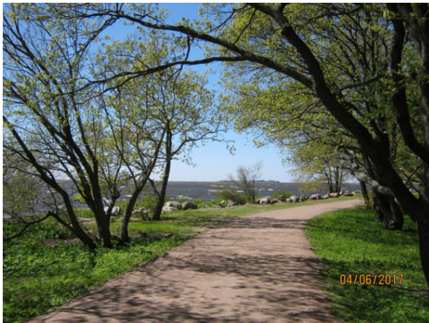
Морские пейзажи парка