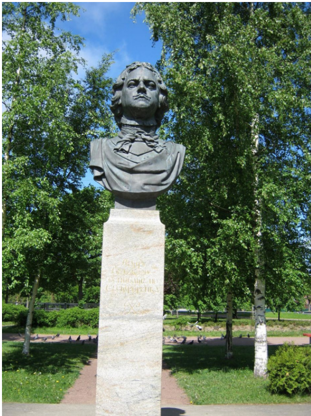
Памятник Петру Великому, основателю Сестрорецка

1714 года он лично обследовал устье Сестры и остался весьма доволен. Эта дата и является Днём Рождения Сестрорецка! Здесь решено было построить Летний дворец и парк.