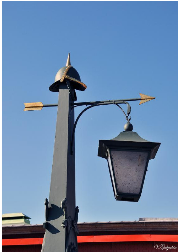
Фонари и фрагменты декора оградительной решётки Иоанновского моста

Длиною чуть более 150 метров и шириной в 10 метров, мост не подавляет своими размерами, но его деревянный настил, гулко «отдающий» шаги, декор оградительной решётки с фонарями «под старину»... Да, связь времён ощущается здесь – неслабо!