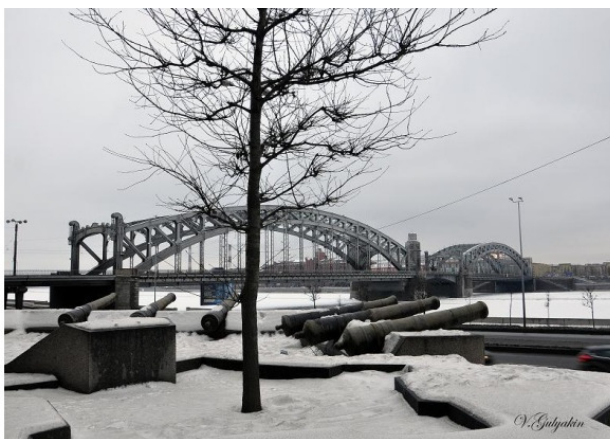
Символическая реконструкция крепости Ниеншанц

Дождливый октябрь 1702 года. Войска сподвижника и друга Петра I, генерал-фельдмаршала Бориса Шереметева берут штурмом шведскую крепость Нотебург. Сам Великий Пётр участвует в этом славном деле! Нет, не в чине Главнокомандующего – упаси, Бог! – а всего лишь бомбардир-капитаном: ему незачем «выпячиваться», он и так – Пётр Великий! Крепость эта, сльвя доселе неприступной, стоит на острове в устье реки Невы и, совместно с другой крепостицей, с Ниеншанцем, что ниже по течению, контролирует, а, говоря попросту, – наглухо закрывает для русских весь водный путь из Ладожского озера в Балтийское море. Через полгода, в начале мая 1703 года, Ниеншанц сдаётся. Без боя.