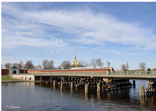
Иоанновский мост через Кронверкский пролив (чрез ту самую протоку)