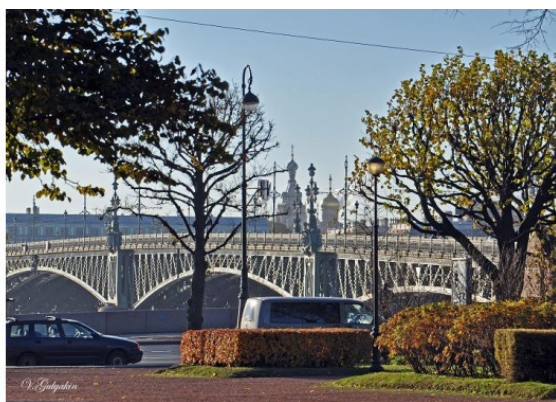
Троицкий мост. Вид с правого берега Невы

Ну а пока взглянем ещё разок на нашего красавца, – на Троицкий мост.