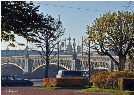
Троицкий мост. Вид с правого берега Невы