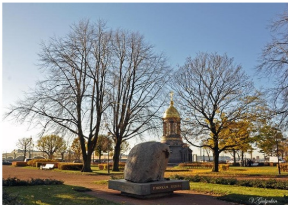
Троицкая площадь (на заднем плане – Троицкий мост)