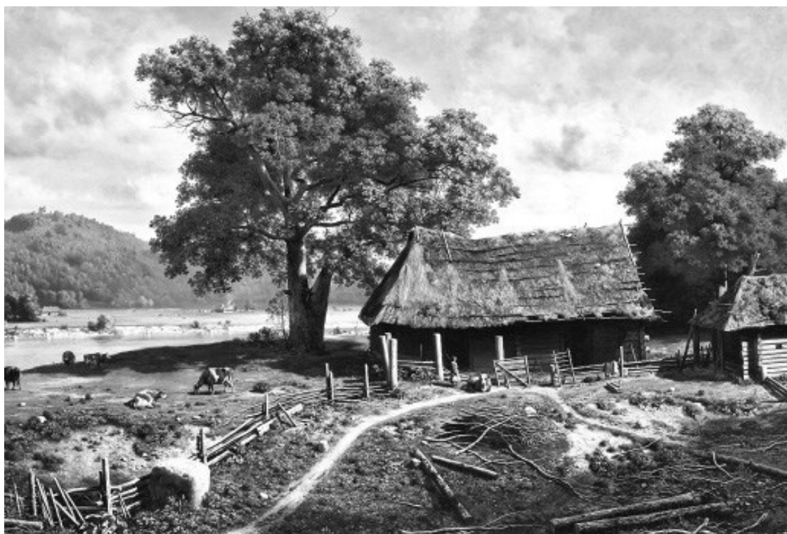
М. Клодт. Усадьба

Мы с братьями также среди мужиков росли, во многих деревенских забавах вполне участвуя. Хаживали с мужиками и на медведя: об этом сейчас расскажу.