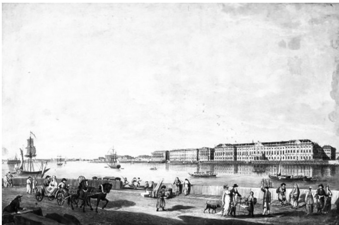
Жерар де-ла-Барт. Вид Дворцовой набережной от Васильевского острова, Санкт-Петербург

Вылезши из своих лесов, я сперва чувствовал себя в Петербурге чужим: учения ведь не было у меня, считай, никакого – хорошо, хоть грамоту знал. А тут по-французски говорят, на балах танцуют, вирши пишут и высокоумные беседы ведут. Ну, кто я при этом? – медведь медведем! Однако вскоре наострился: несколько слов французских затвердил, большего по сей день не знаю, из разговоров кое-чего запомнил, а главное, танцам выучился. Ничего, обходился как-нибудь: в конце концов, от солдата учёность не требуется – были бы смелость да отвага, да верная служба российскому престолу!