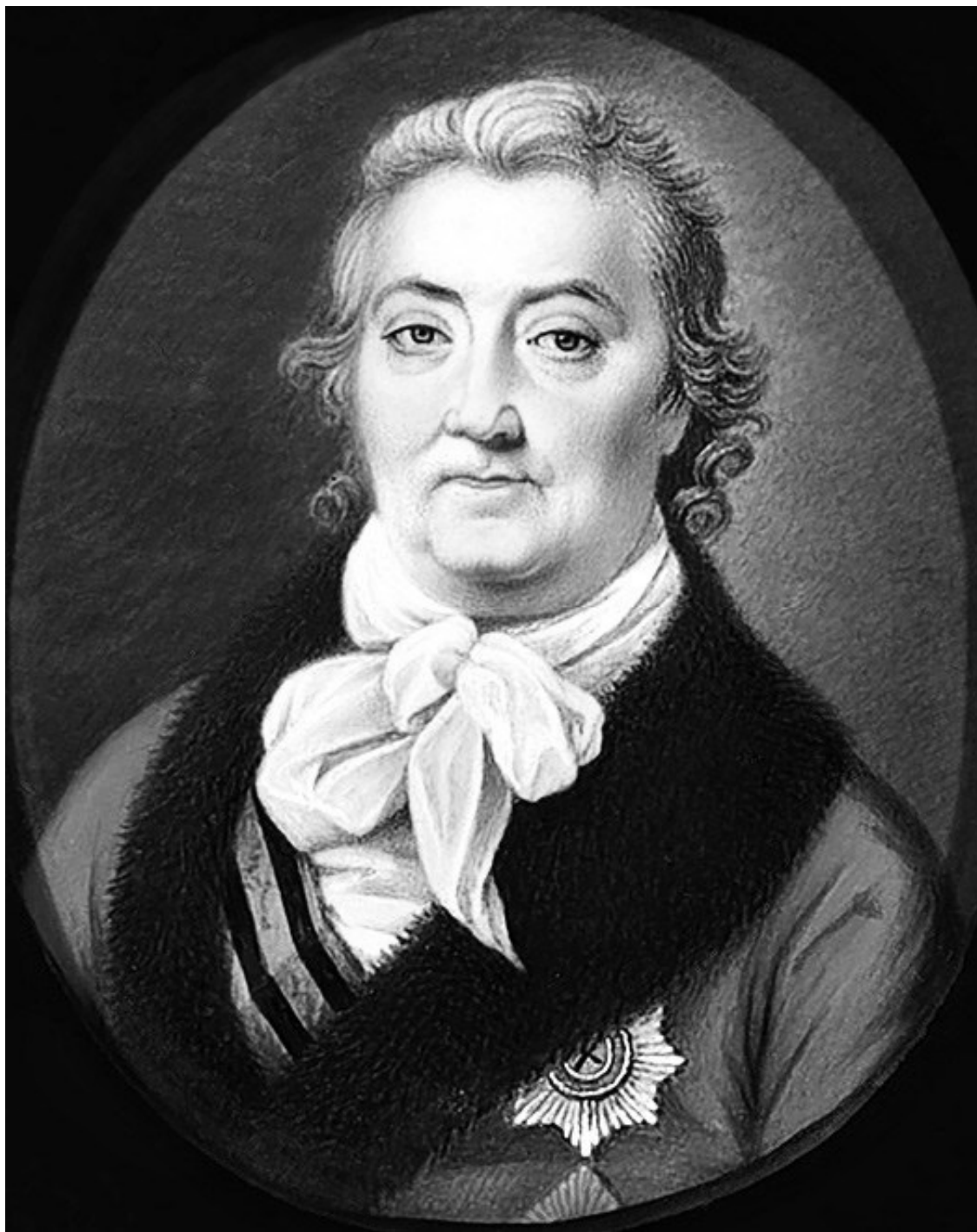
Граф Алексей Григорьевич Орлов, начало 1800-х годов

Граф называл её «Нинушкой», с ударением на «у», а она с неподдельной любовью величала его «батюшкой», но обращаясь при этом на «вы». Когда он недомогал, она дни и ночи сидела возле его постели, да он никого другого и не допустил бы до себя, не доверяя лекарям и ругая их шарлатанами.