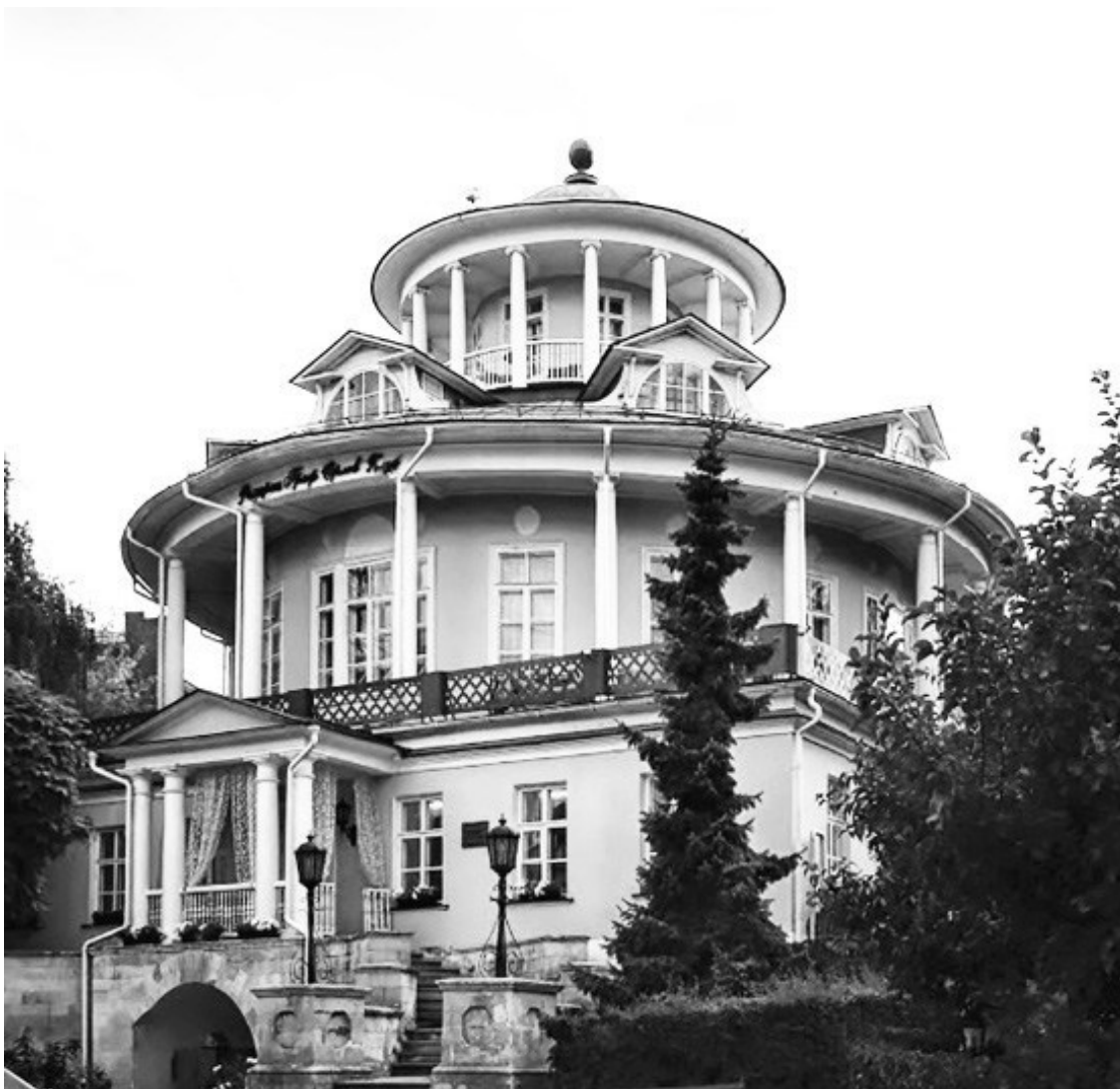
Главный дом усадьбы графа Орлова на Донском поле в Москве

– Батюшка, умоляю, прислушайтесь к словам Алексея Андреевича, – вмешалась молодая графиня.