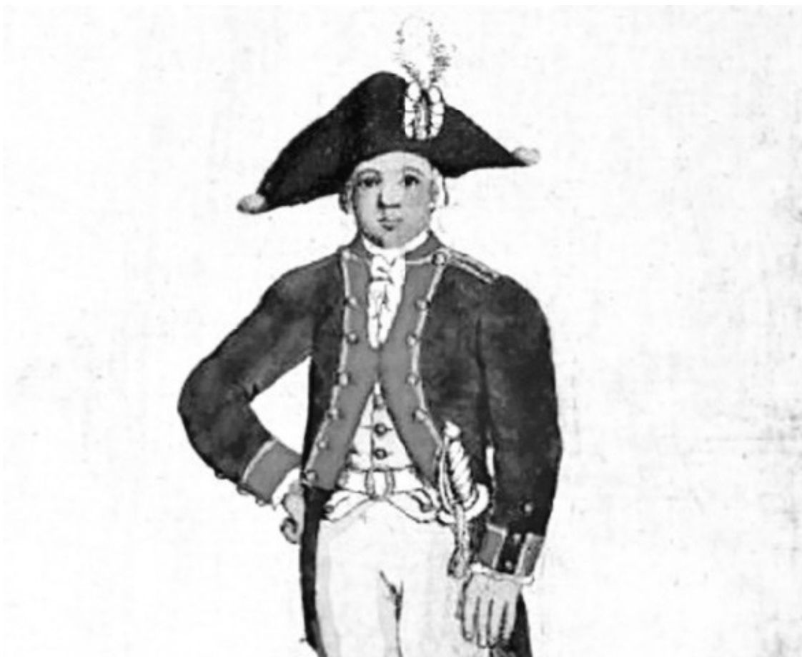
Кадет в мундире. Середина XVIII века

Петербург меня так поразил, что первое время я ходил по городу разиня рот. Какой простор, какие красоты; вот уж поистине столица великой империи! Главная улица – Невский проспект – широченная и за горизонт уходит, а дома на ней только каменные, ни одного деревянного, их указом строить было запрещено. Каждый дом в два этажа и узорчатой чугунной решеткой ограждён.