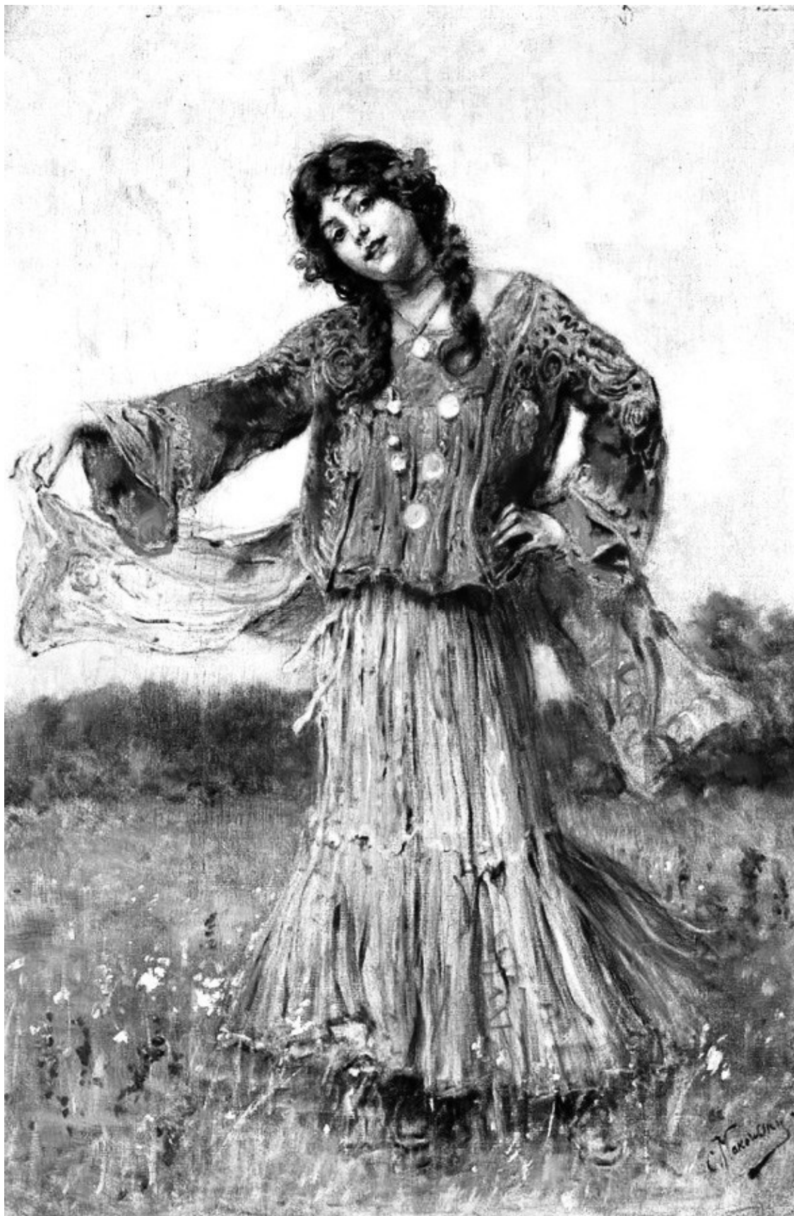
К. Маковский. Танцующая цыганка

Цыгане заиграли и запели, вначале медленно и тихо, потом всё быстрее и громче, – и так же медленно, а потом всё быстрее плясала Ляля. В её танце не было правильности, не было