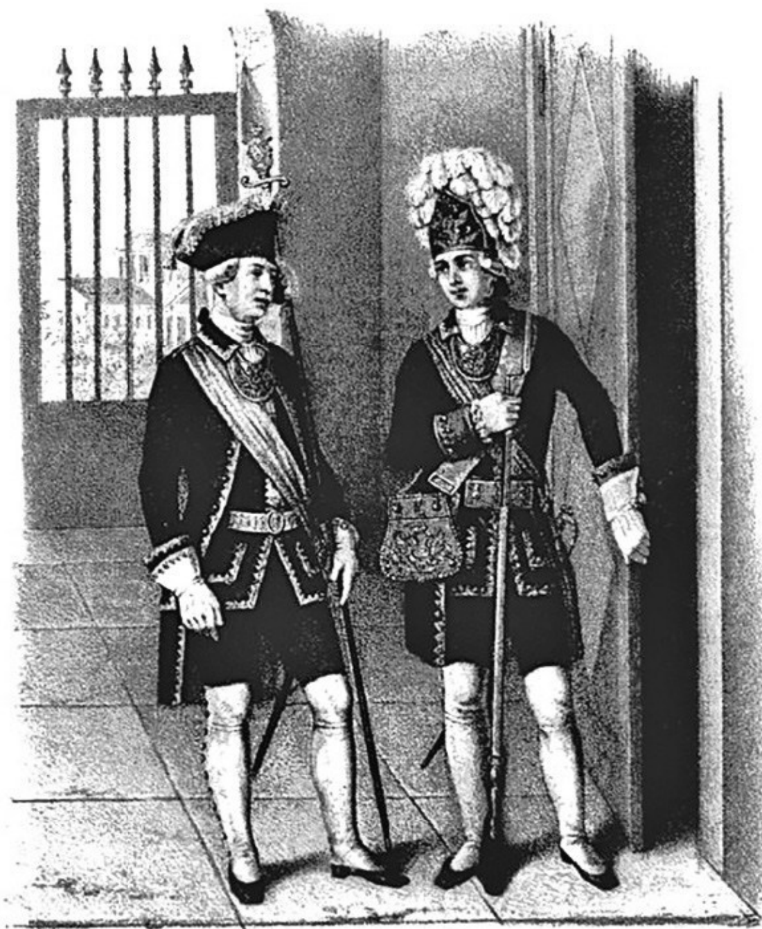
Офицеры Преображенского полка в середине XVIII века