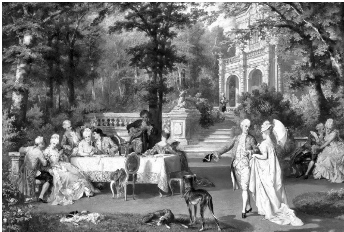
К. Швенигер. Галантное общество в парке

– Вот молодец! – сказал граф и расцеловал меня. – Я тебя тоже порадую... Ляля, Ляля, Лялечка! – позвал он. – Иди к нам, моё солнышко, спой для меня и моего сердечного приятеля Алексея.