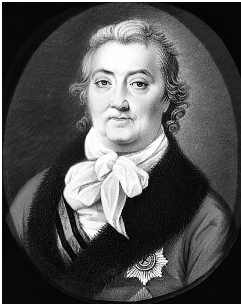
Граф Алексей Григорьевич Орлов, начало 1800-х годов