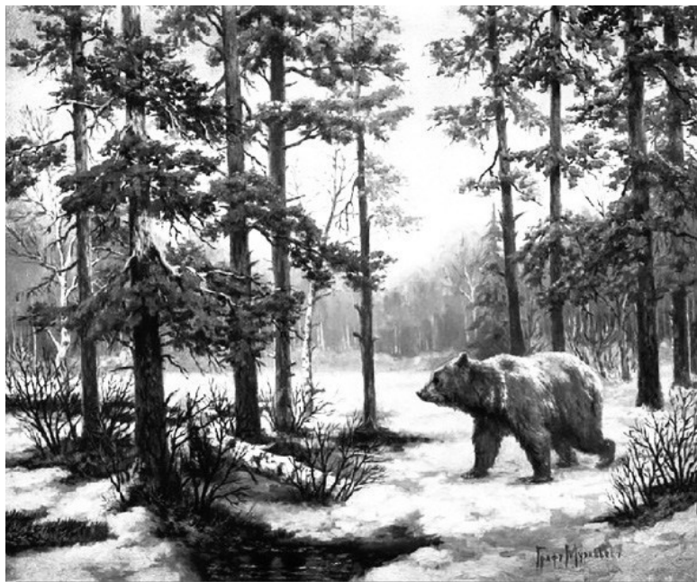
В. Муравьев. Медведь в лесу