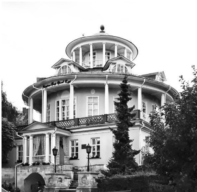
Главный дом усадьбы графа Орлова на Донском поле в Москве

– Батюшка, умоляю, прислушайтесь к словам Алексея Андреевича, – вмешалась молодая графиня.