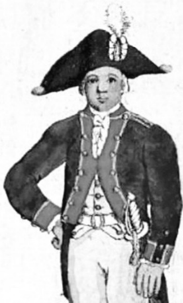
Кадет в мундире. Середина XVIII века

Петербург меня так поразил, что первое время я ходил по городу разиня рот. Какой простор, какие красоты; вот уж поистине столица великой империи! Главная улица – Невский проспект – широченная и за горизонт уходит, а дома на ней только каменные, ни одного деревянного, их указом строить было запрещено. Каждый дом в два этажа и узорчатой чугунной решеткой ограждён.