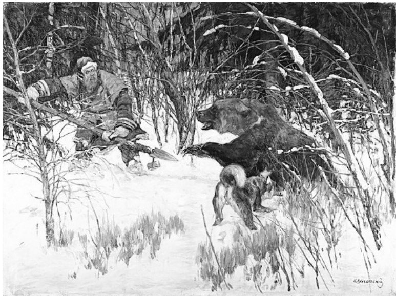
К. Высотский. Былая потеха (На медведя с рогатиной)

но в медвежье сердце! Издал зверюга предсмертный рык и упал, но всё-таки достал меня когтями напоследок. Вот она, зарубка медвежья, – граф закатал рукав и показал шрам, – на всю жизнь осталась... А шкуру его мы домой принесли и на стену повесили: она всё место от пола до потолка заняла. Матушка заахала: «Знала бы, что вы на такое чудовище по-шли, никогда бы не отпустила!»»