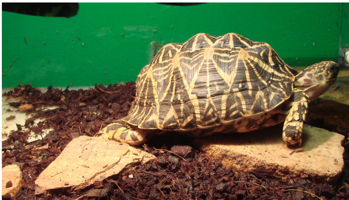
Черепашка из породы хищников

– Ах ты, крокодил зубастый! Целый месяц притворялся, ничего не ел, копил силы! Не Худик ты, а акула зубастая и пузатая!