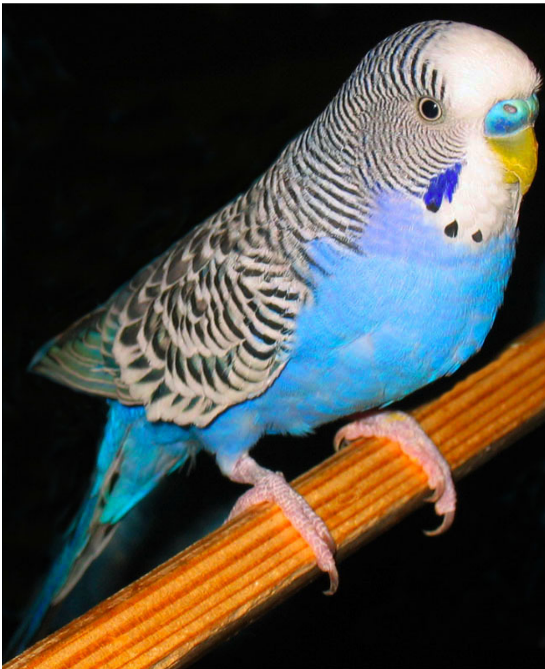
Волнистый попугайчик (самец) Рика

Он почувствовал теплое рукопожатие брата. Витя шепнул ему на ухо: «Смотри внимательно под стол, видишь там чего?»