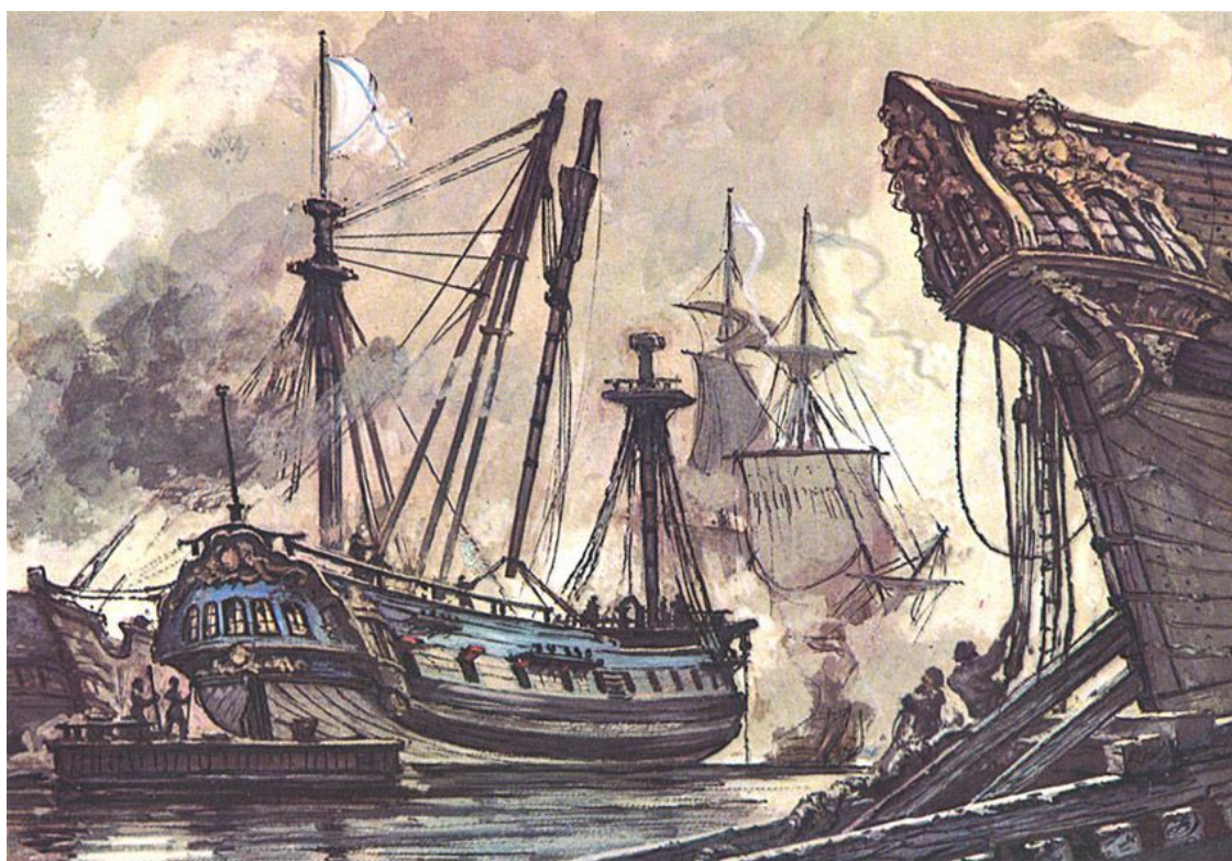
Гравюра И.М. Билля. Кинбурн во время боя

Когда хитрый враг на тебя нападает, Кулак мой ускорит защиту отца, От раны и смерти тебя он спасает, И близко не станет чужого лица