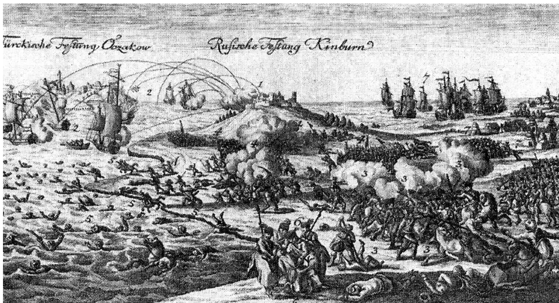
Гравюра Иоганна Мартина Билля. Кинсбурнская баталия 1787

Десант продвигался от Черного моря, Сбежались на берег шесть тысяч врагов, Десант завлекали подальше от взморья, Стратегия эта важна для мозгов!