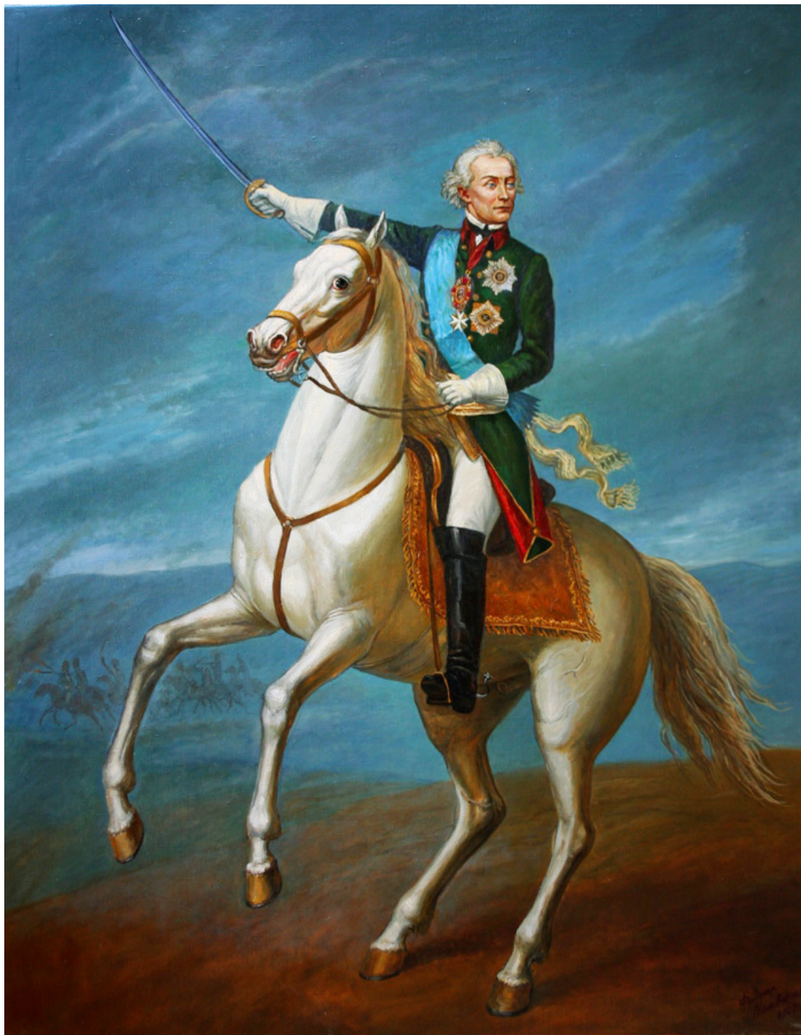
Ф.А. Москвин. Генералиссимус Суворов