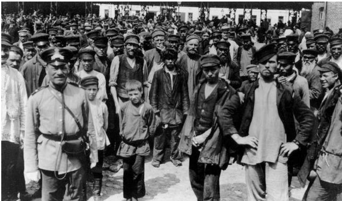
Питерские рабочие, дети-подростки и урядник начала XX века

на фабрику, но работал я там не долго – приехал из Питера родственник и увез меня с собой, чтобы пристроить в мальчишки к какому-нибудь торговцу.