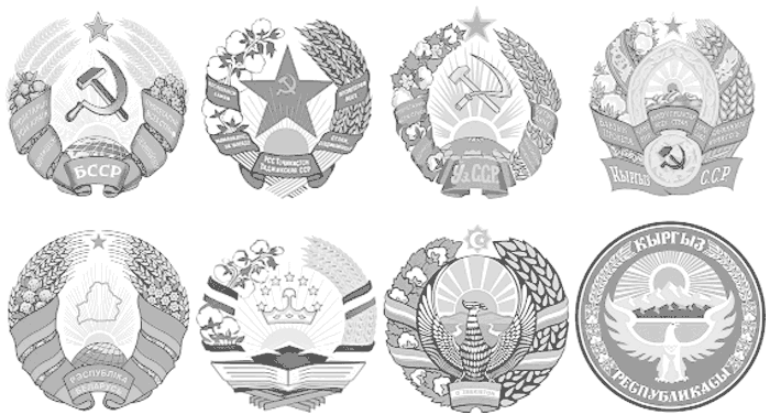
Рис. 3. Созданные в сталинскую эпоху гербы Беларуси, Таджикистана, Узбекистана, Киргизии (сверху) и гербы этих республик в наше время (снизу)

в гербе Таджикистана – на изображение короны и звездного полукруга, в гербах Узбекистана и Киргизии – на изображения мифических птиц с раскрытыми крыльями. Из этих гербов, за исключением герба Беларуси, исключена и советская красная звезда – символ единства мирового пролетариата. Вместе с тем эти гербы, имея общее сходство с гербом СССР, сохранили свою округлую форму, изображение восходящего солнца – символа светлого будущего, ряд других элементов сталинской геральдики (в зависимости от герба – витую ленту, земной шар, горы, название республики), в том числе расположенные по бокам гербов в виде полуленок изображения сельскохозяйственных культур, выращиваемых в республиках, – ржаных колосьев, ветвей льна и клевера в Беларуси, пшеничных колосьев и ветвей хлопчатника в Таджикистане, Узбекистане и Киргизии. Современный флаг Беларуси, в обличье которого доминирует красный цвет флага СССР, базируется на флаге республики, принятом в сталинский период, с исключением из него серпа, молота и красной звезды.