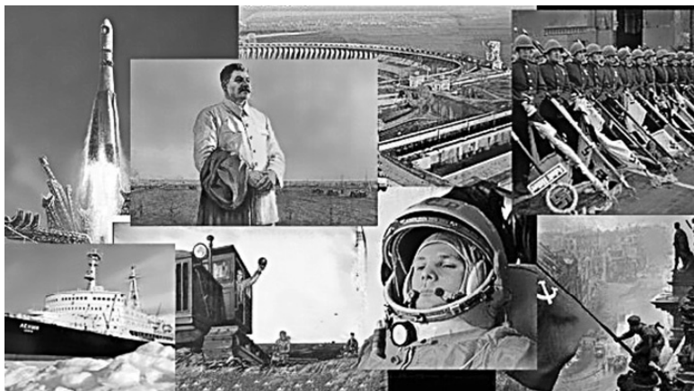
Рис. 2. Достижения сталинской экономики

бирают для ее описания – тоталитарная, казарменная, репрессивно-командная, деспотичная, лагерная экономика... Те, кто дает такие уничижительные определения, навряд ли уяснили, что большинство наших достижений и побед, которыми мы гордимся сегодня и будем гордиться всегда, родом именно из сталинского времени (рис. 2). А подневольным, непроизводительным рабским трудом крепкую экономику, сильную державу с развитым индустриальным, научным, военным потенциалом не построишь.