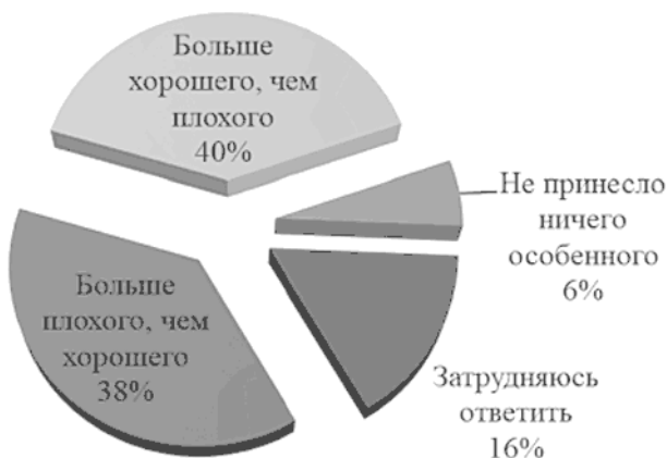
Рис. 4. Оценка эпохи Сталина согласно результатам все-российского опроса общественного мнения, проведенного «Левада-Центром» в феврале 2016 года 40