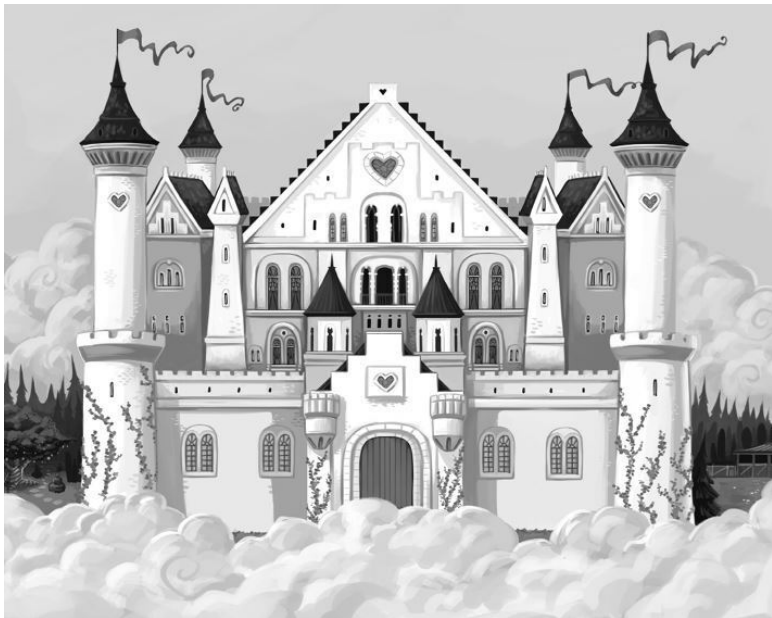
Дворец Звезды Желаний