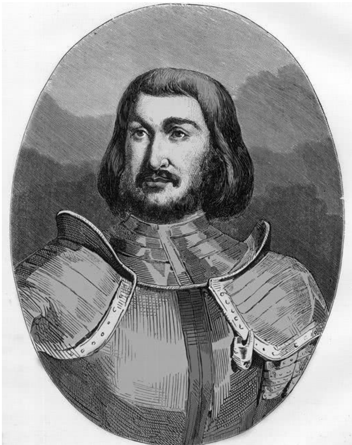
Портрет Жилия де Рэ (Гуль де Наваль, 1835)

...Или не казнили. Существует несколько версий спасения Жанны. По крайней мере, одна из женщин, выдававших себя за спасшуюся Деву, Жанна дез Армуаз, была признана «настоящей» немалым количеством людей, знавших Жанну д'Арк лично. По слухам, с дез Армуаз встречался и Жиль де Рэ. Подтвердить или опровергнуть это невозможно.