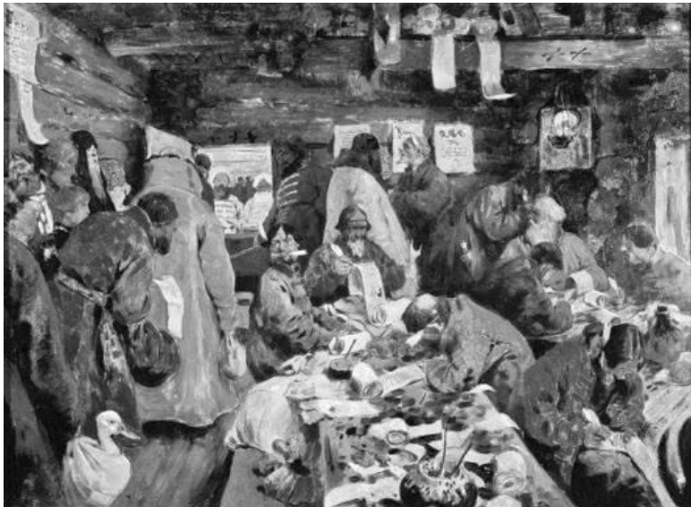
«В приказной избе» (С.Иванов, 1907)