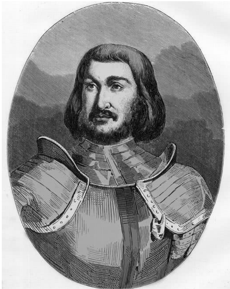
Портрет Жиля де Рэ (Гуль де Наваль, 1835)