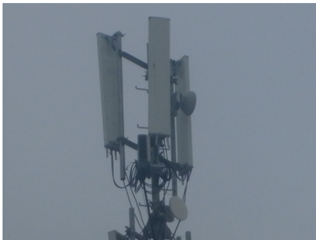
Мачта бывшего ночного клуба.

Мечты и образование с друзьями заставили некоторых друзей с героем отправиться в досуг в котором можно научиться сексу и понять чем любовь отличается от секса с алкоголем, можно подумать рассказывается история поездок в квартиры которые сдаются под апартаменты досуга, но любопытство героев уже нескольких набирает большой оборот, раньше не было встреч в клубах в которые приезжают любители сексуальных знакомств, а просто секс есть на улице и в квартире, в ночном клубе который закрывается при налете сотрудников неизвестной группы в масках и принимают решение о его закрытии в будущем. Все это говорит, что нужно закрывать клубы те которые нарушают нравственность и воспитание молодого поколения, лучше построить в место одного клуба здание судебных приставов и областную рядом прокуратуру, а другой клуб закрыть и построить пожарную часть рядом от МЧС, третий ночной клуб закрыть и сделать там рядом с гостиницей «Бристоль» вещевого рынок из клуба «Фламинго», а четвертый ликвидировать в Д.К.«Юбилейный» и открыть там ледовый каток вместо подвального салона стриптиза.