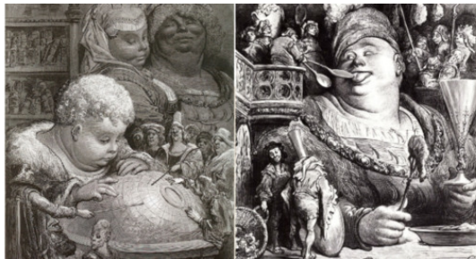
На иллюстрации Гюстава Доре к «Гаргантюа и Пантагрюэлю» Ф. Рабле

Слежалась стелька в темном передке у одного из вытопанных тапок, в передней сумрачно, и на половике ботинок мокрый повалился набок