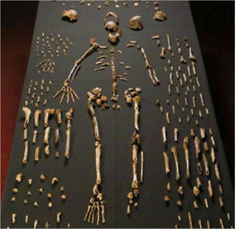
Рис. 1

далеку от Йоханнесбурга, обнаружили в самых отдаленных подземных лабиринтах никому не известный до того проход.