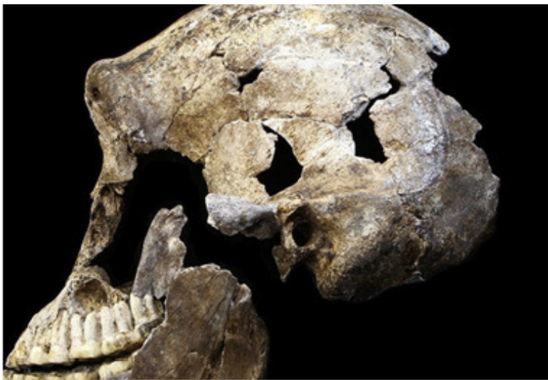
Рис. 2

– Но все-таки, почему же, на ваш взгляд, упомянутые особенности «конструкции» Homo Naledi позволяют говорить о нем именно как о деграданте? Разве нельзя предположить, что эти довольно примитивные существа еще только движутся в своем развитии к «человеческому совершенству»?