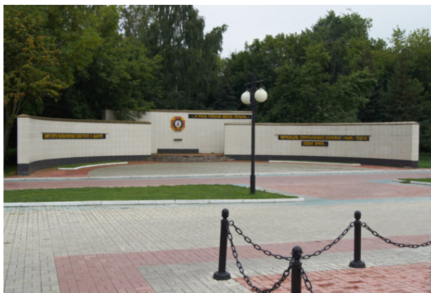
Йошкар-Ола. Мемориал жертвам радиационных катастроф и аварий.

риал жертв локальных войн, напротив – памятник жертвам радиационных катастроф и аварий. Почтил память воинов-интернационалистов минутой молчания. И невольно обернулся, чтобы долг памяти своей отдать жертвам «мирного» атома. На центральном фасаде памятника желтым цветом на черном фоне (цветовая гамма международного знака радиации) выбито: «... И упала горькая звезда полынь...». На левой стороне мемориала надпись: «Памяти жертв радиационных катастроф и аварий». На правой стороне мемориала колонтитул: «Чернобыль, Семипалатинск, комбинат «Маяк», Тощкая, Новая Земля...». Очень надеюсь, что доживу до того дня, когда в колонтитуле мемориала появится дополнение и надпись будет выглядеть следующим образом: «Чернобыль, Семипалатинск, Отортен , комбинат «Маяк», Тощкая, Новая Земля...». И каждый год жители нашей страны и зарубежные гости, склонивши голову возле мемориала, минутой молчания почтят память погибших туристов группы «Хибина», забытых героев советского атомного проекта.