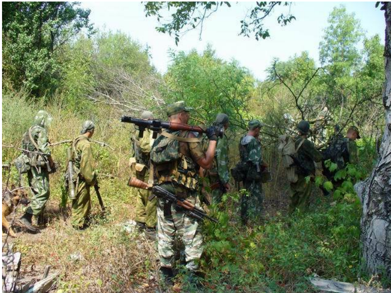
Фото: Вблизи трассы Баку-Ростов. Окрестности Грозного.