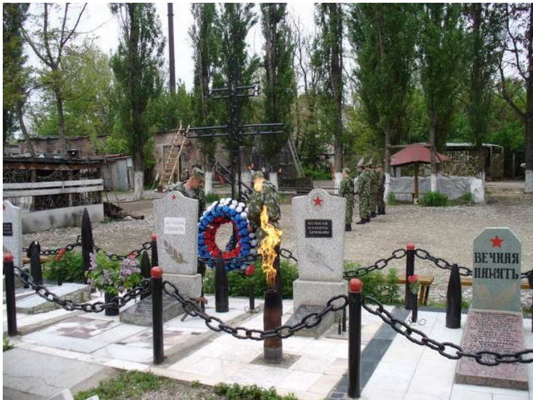
Фото: Памятники обелиски погибшим сотрудникам. ПВД УВД ХМАО. г. Грозный.