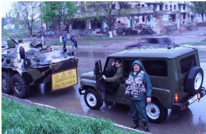
Фото: Грозный. Перед "Романовским мостом". Инженерная разведка пятой комендатуры и ОГ.