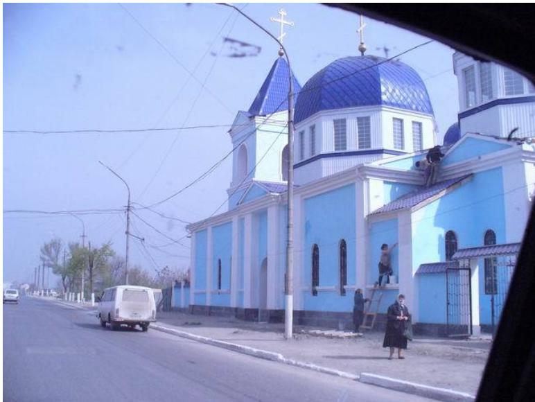
Фото: восстановленный храм. Грозный. Апрель 2006.