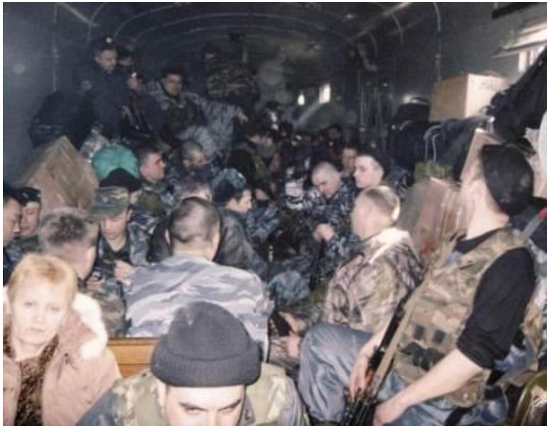
Фото "Уютный бронепоезд Козьма Прутков"