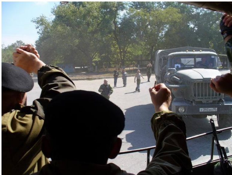
Фото: Прощайте горы...

Задубел, разжирел, и иссякнул бы я, И засох пирогом, на запущенном тесте.