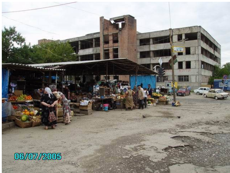
Фото: Рынок. Улица 8 марта. Грозный.

И быстро ушла, как степной суховей, Спасибо старушка! Здоровья! Добра! Не видел я взгляда нежней и добрей.