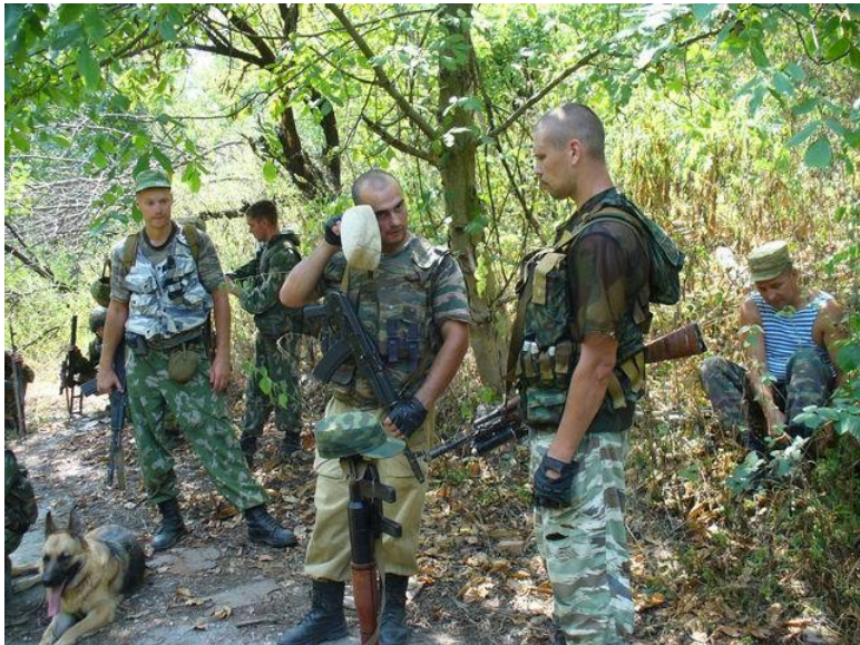
Фото: Вблизи поселка Гикаловский. Чечня