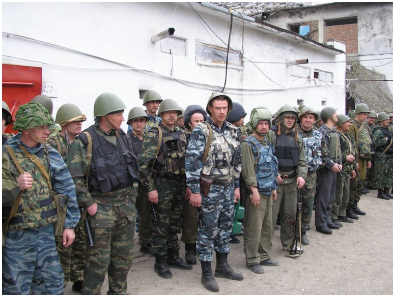
Фото: Пункт Временной Дислокации по ул. П. Мусорова.