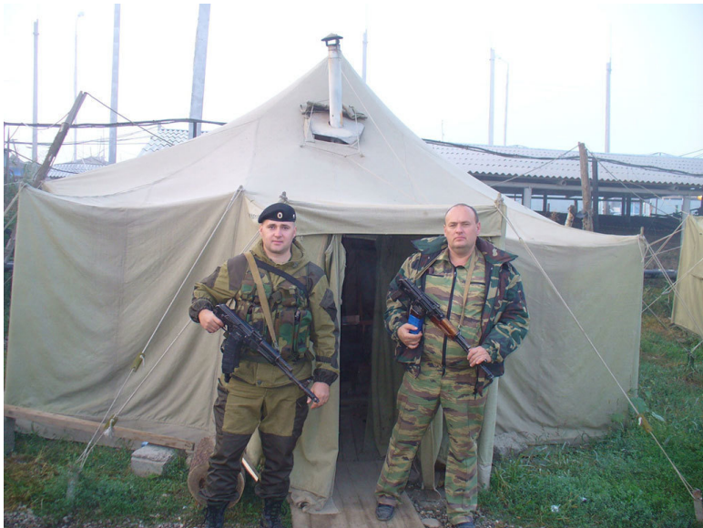
Фото: Броня крепка, палатки наши крепки.