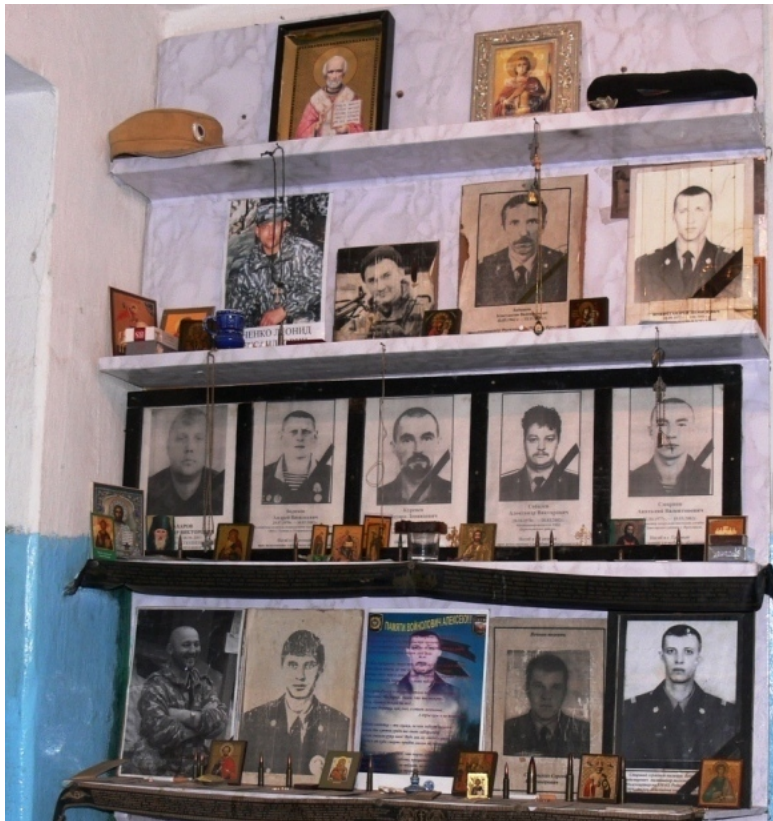
Фото: Уголок памяти в помещении Огневой Группы. г. Грозный. ПВД ул. Трамвайная.