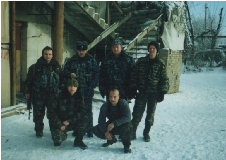
Фото: декабрь 2002 г. Грозный.