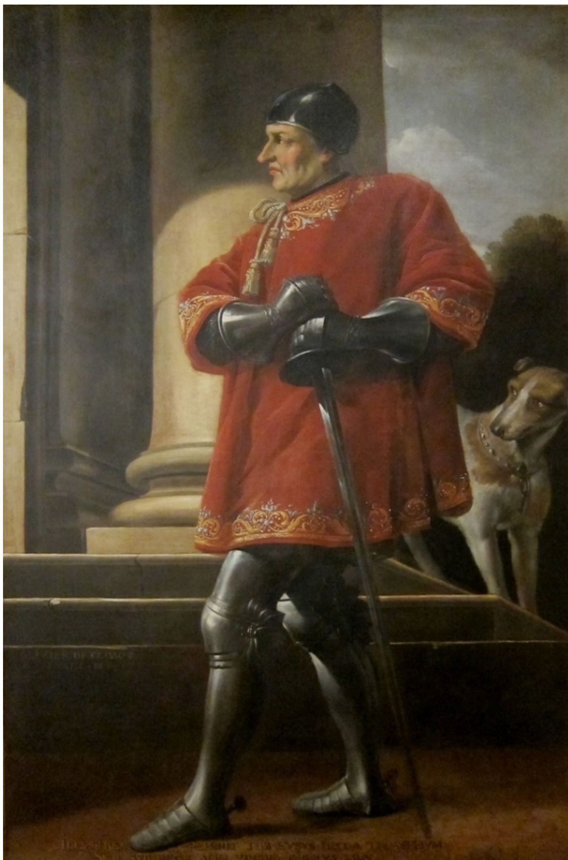
Оливье де Клиссон