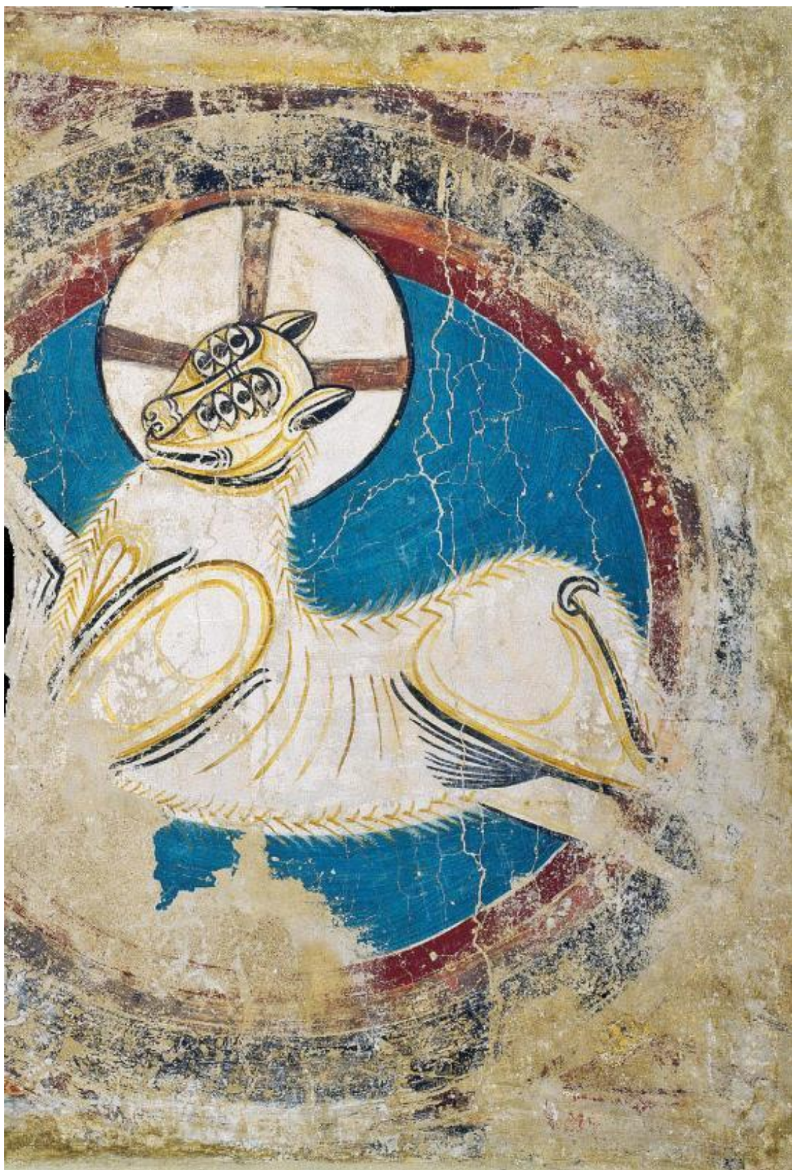
«Агнец Апокалипсиса». Фреска из церкви Сан-Клементе-де-Таулл, ок. 1123 г. Национальный музей искусства Каталонии (Барселона)