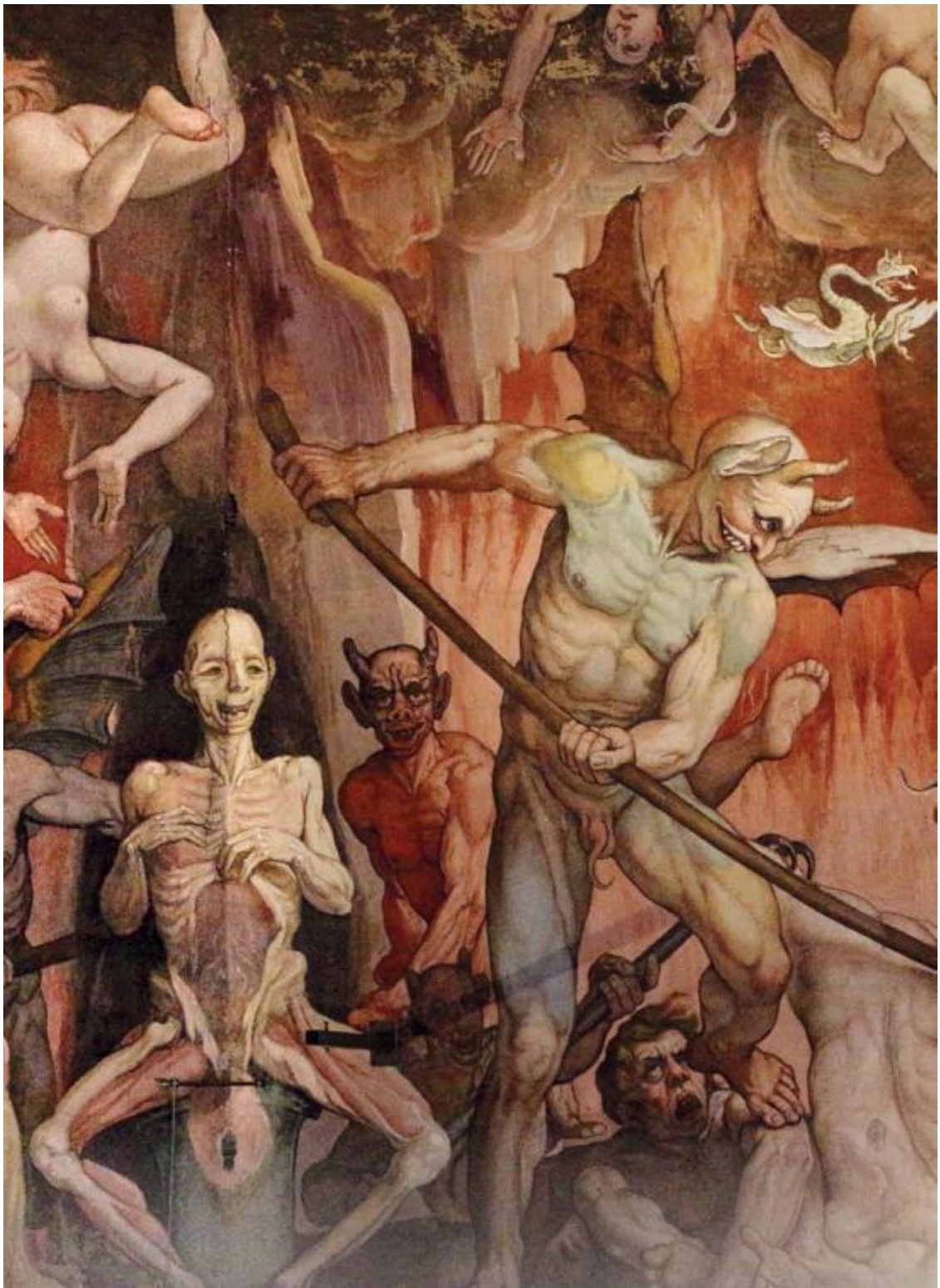
Федерико Цуккари. «Ад», фрагмент росписи купола «Страшный суд», 1574–1579 гг. Собор Санта-Мария-дель-Фьоре (Флоренция)

Итак, давайте отправимся на экскурсию в музей христианского Апокалипсиса.