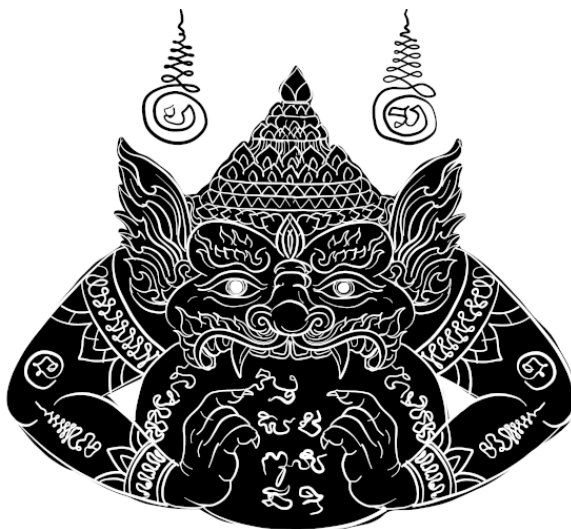
Рис. 2. Раху заглатывает Солнце. Солнечное затмение нередко воспринималось древними как акт пожирания Солнца сверхъестественными существами

Упомянем, что затмения в некоторых мифах рассматриваются не как акт поедания одного светила другим, а как акт их совокупления.