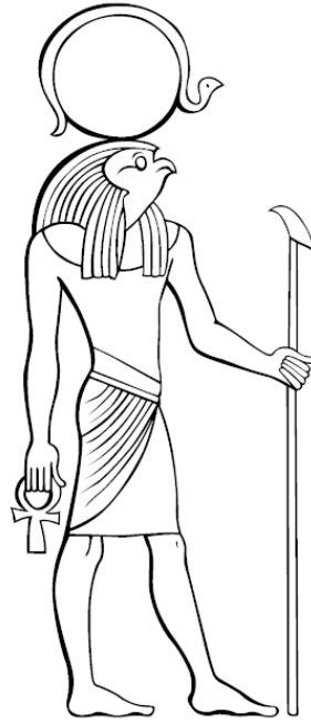
Рис. 1. Египетский бог Солнца Ра

Любопытно, что транспортировка бога Ра по твердому небу осуществлялась при помощи ладьи – большой лодки. Для египтян перемещение по главной реке страны – Нилу – было основным и наиболее совершенным видом перевозки грузов. Поэтому египетские рисунки на папирусе и настенные фрески не показывают нам колесницу бога Солнца – в отличие от представлений греков, викингов, ведических племен Индии, у которых светило перемещается именно при помощи колесницы.