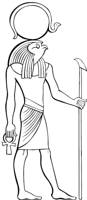
Рис. 1. Египетский бог Солнца Ра

Любопытно, что транспортировка бога Ра по твердому небу осуществлялась при помощи ладьи – большой лодки. Для египтян перемещение по главной реке страны – Нилу – было основным и наиболее совершенным видом перевозки грузов. Поэтому египетские рисунки на папирусе и настенные фрески не показывают нам колесницу бога Солнца