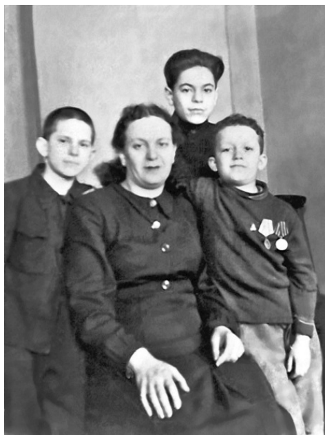
Иосиф Кобзон с матерью и братьями

Нравилась ей песня “Дывлюсь я на нэбо, тай думку гадаю...” И мне тоже понравилась. Я любил подпевать маме. Долгими вечерами при керосиновой лампе это было какое-то волшебное, какое-то завораживающее действие и зрелище. Тоску сменяла радость, слезы – веселье, когда пела свои любимые песни мама. И, вероятно, именно тогда я навсегда “отравился” пением. Песни стали моими наркотиками. Пройдет целая жизнь. И в 2001 году, когда часы начнут отсчитывать, быть может, мои самые трагические минуты, когда мое “я” будто маятник, будет колебаться между жизнью и смертью, а потом врачи скажут, что я все-таки останусь жить, первое, что я попробую сделать, – это проверить: а сохранила ли моя память хотя бы какие-нибудь песни? Я тяжело начну вспоминать незабываемые строки и с трудом, хотя бы мысленно, произносить отдельные слова, а затем рискну попробовать... петь, чтобы узнать: не отказал ли голос?! И узнав, что голос возвращается, и что я опять буду петь, я пойму, что жизнь моя действительно продолжается...»