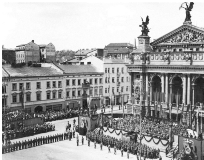
Львов в годы фашистской оккупации. 1942 год