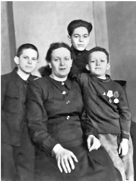
Иосиф Кобзон с матерью и братьями

Нравилась ей песня “Дывлюсь я на нэбо, тай думку гадаю...” И мне тоже понравилась. Я любил подпевать маме. Долгими вечерами при керосиновой лампе это было какое-то волшебное, какое-то завораживающее действо и зрелище. Тоску сменяла радость, слезы – веселье, когда пела свои любимые песни мама. И, вероятно, именно тогда я навсегда “отравился” пением. Песни стали моими наркотиками. Пройдет целая жизнь. И в 2001 году, когда часы начнут