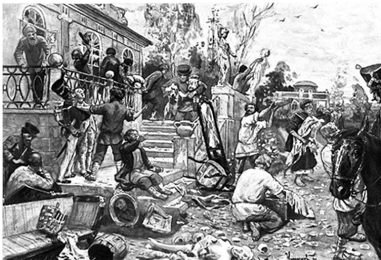
Крестьянский бунт. В. Верещагин.

Да... Их было уже много, однако в большинстве своём это была злая, но ничтожная в военном смысле толпа.