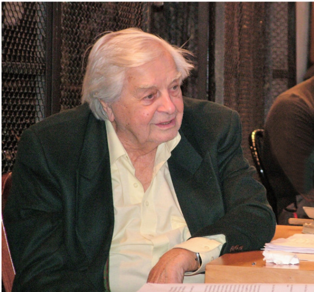
Юрий Петрович Любимов