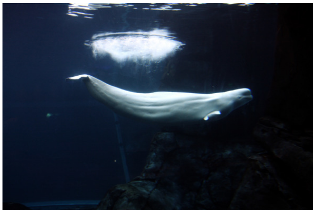
Белый кит – белуха

мы им теперь все больше туристов возим: моржам-то скучно на островах, и медведи им уже надоели – они друг на друга веками любят. А турист – моржу само развлечение: он и одет всегда ярко, и руками машет, как кого увидит, и нам заработок. Вот так и живем, с моржами в дружбе, и они вроде у нас на службе. Еще мы с белухами подружились: это не рыба-белуга, а дельфин такой, длинный, белый и добрый.