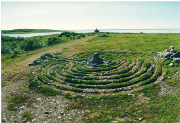
Каменный лабиринт на Большом Заяцком острове, Соловецкий архипелаг

сячелетиях до нашей эры неизвестной культуры. Сегодня на морском побережье, рядом с устьями рек, на островах России (Архангельская область, республика Карелия, Мурманская область), Швеции, Норвегии, Финляндии, Великобритании, а также на островах Балтики исследователи находят оставленные неведомым народом каменные лабиринты.