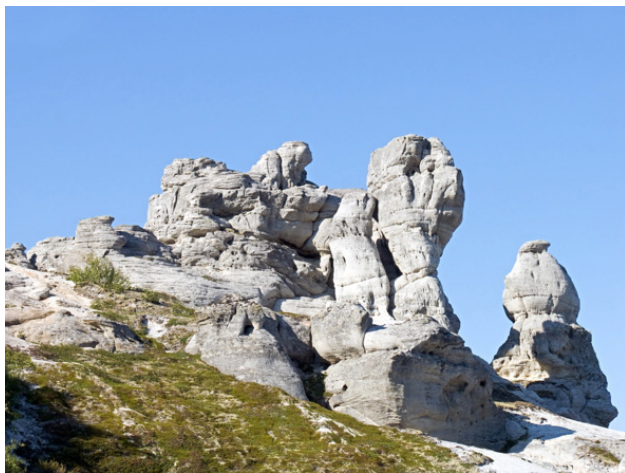
Тиманский кряж. «Белый город»

равнинные, все, что выше мельницы ветряной, горами зовем. На северо-западе равнины нашей Ветреный пояс стоит, на востоке – Тиман, на самом севере – Канин камень, на юге Коношско-Няндомская возвышенность расположилась, а уж хребет Пай-Хой – тот и вовсе выше самой высокой Джомолунгмы будет. ( Ветреный пояс – высоты до 344 метров, Тиман – до 303 метров, Канин камень – до 242 метров, хребет Пай-Хой – до 467 метров, Коношско-Няндомская возвышенность – до 250 метров ). Ни один помор в такую верхоту без нужды не полезет, если только к соседу сбегать, байку каку послушать.