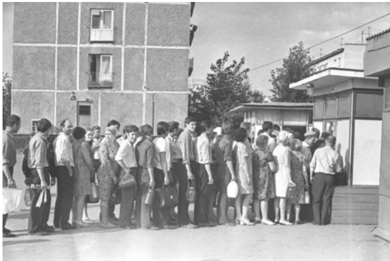
Пиво в СССР