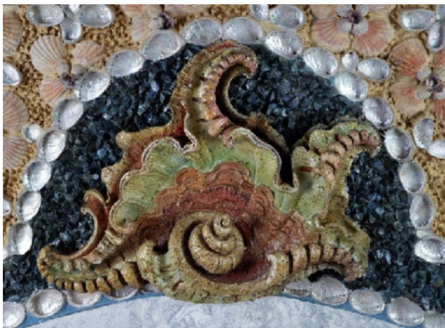
Фрагмент стены. Новый дворец. Потсдам

И каждая штучка в отдельности — Шедевр, совершенство, законченность, Моллюска большие труды. А тыщи ракушек в пристенности, В лихие круги завороченных, — Безвкусица чистой воды.