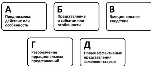
Рисунок 3. Модель Эллиса

Рисунок 3 иллюстрирует методику Эллиса в целом. Рисунок 4 – конкретный пример с падением из-за неправильной техники хвата.