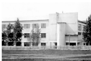
Рис. 4. 1950 год. Кемеровский горный институт

Ну, а в ночь наступления Нового года, мы, салаги, оставшись втроём в своей комнате – «старички» разъехались по домам, – открываем бутылку водки (впервые в жизни пробую её вкус), банку рыбных консервов и банку баклажанной икры, режем хлеб, разливаем водку в стаканы и с последним скачком часовой стрелки к двенадцати и ударом «курантов» (репродуктор включён у нас постоянно) залпом опрокидываем стаканы с отвратительным горьким напитком: «С Новым, тысяча девятьсот пятьдесят первым годом, товарищи!»