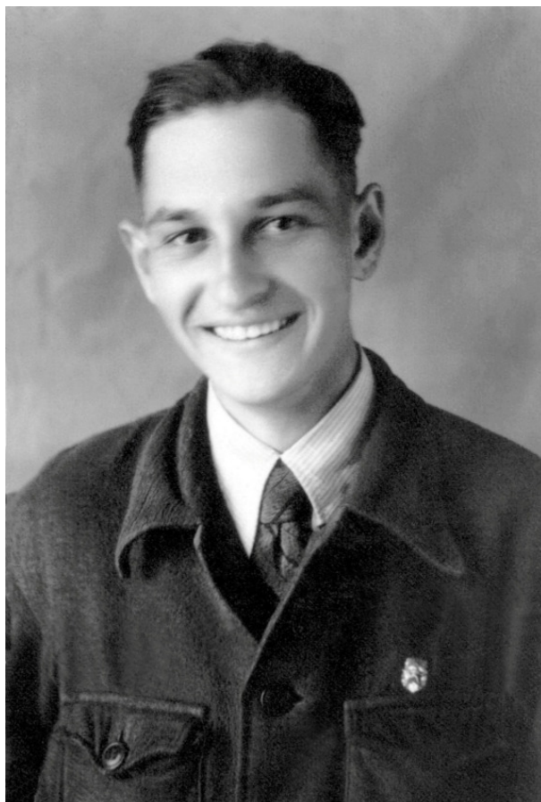
Рис. 5. Первокурсник