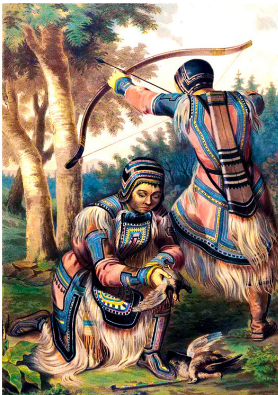
TOUNGOUZES DES BOIS. ЛЕСНЫЕ ТУНГУСЫ.