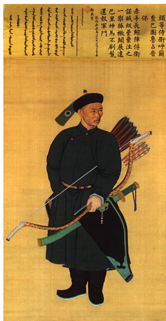
Маньчжур в традиционном наряде (Википедия)