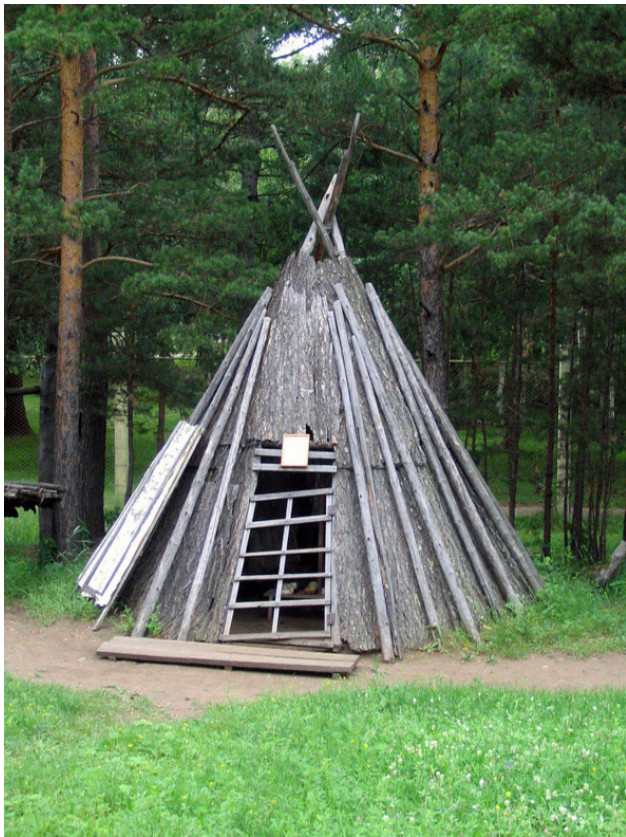
Модель чума, сделанная из дерева. Экспонат Этнографического музея народов Забайкалья.