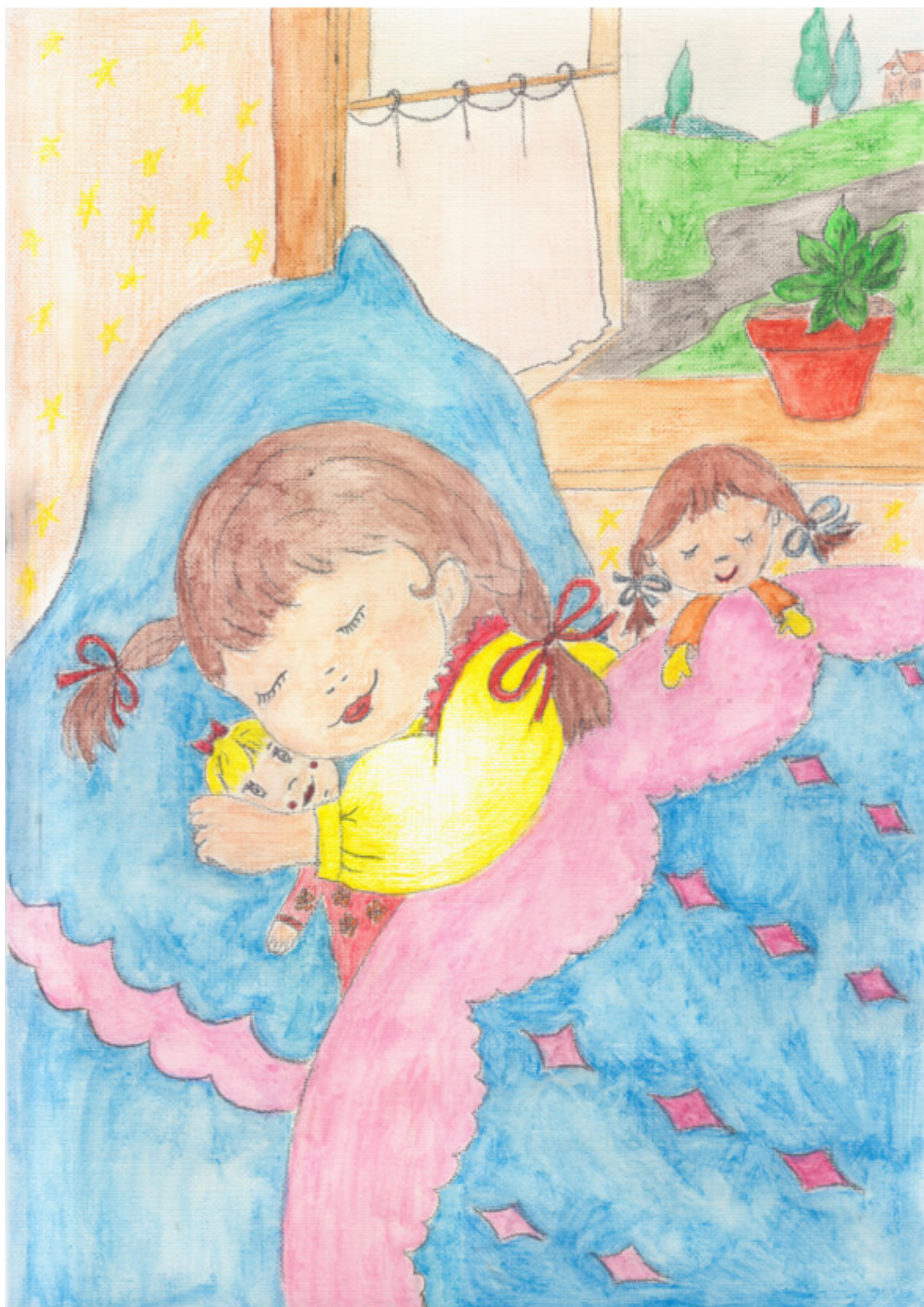
иллюстрация Писанской Ирины (идея взята из сети интернет)

Завтра будет день опять, Будем мы с тобой играть, Сказку про ежа прочтём, Песнь любимую споём,