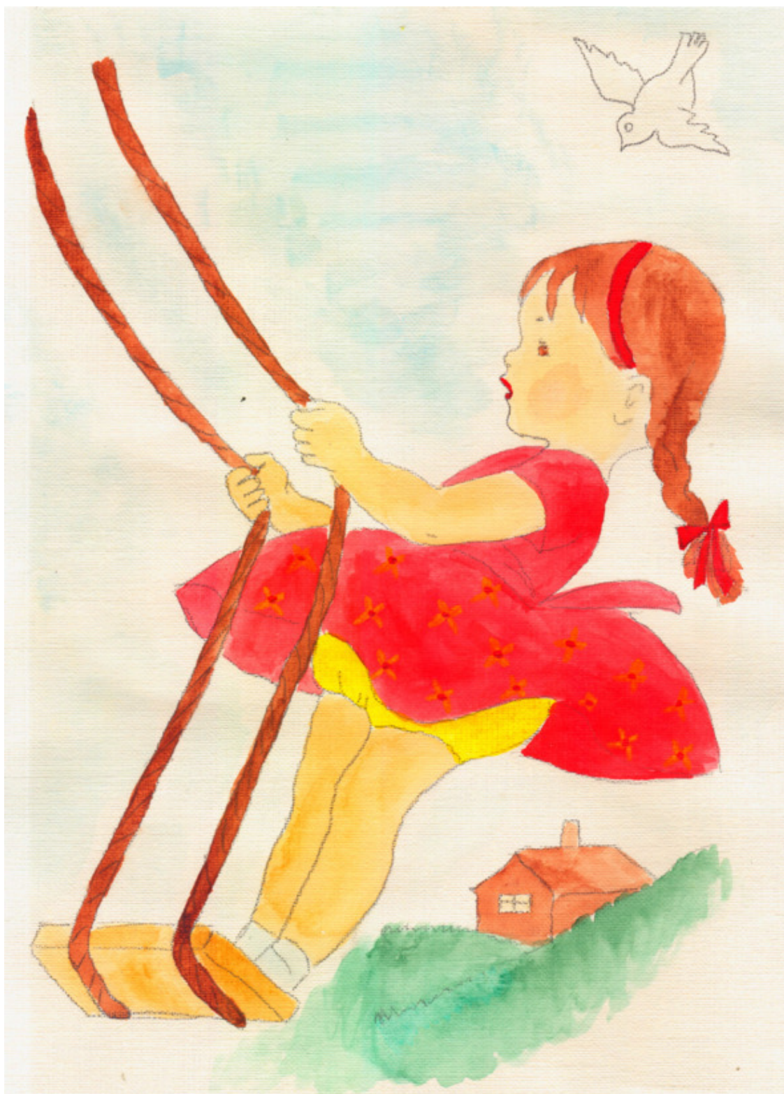
иллюстрация Писанской Ирины (идея взята из сети интернет)