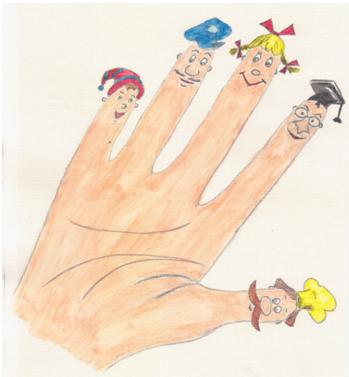
иллюстрация Писанской Ирины (идея взята из сети интернет)