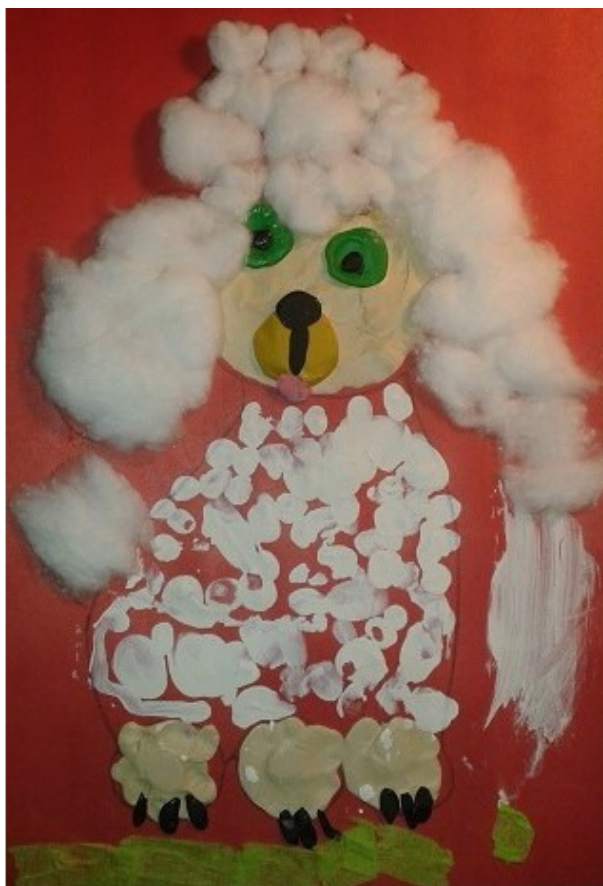
поделка Писанской Марины

Каждый день я с ней гуляю, Глажу, на руках ношу, Вместе с Юсей я играю, И теперь я не грущу!