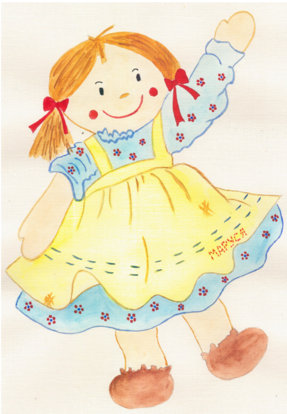
иллюстрация Писанской Ирины (идея взята из сети интернет)

«Да, конечно, несомненно, Есть любимая, скажу, Это новая игрушка,