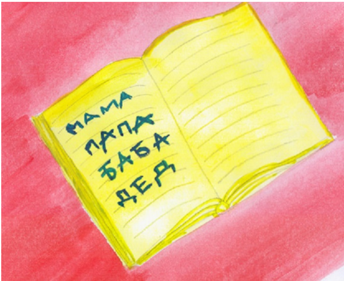
иллюстрация Писанской Ирины

Научу писать красиво, Ручку правильно возьми, И не бойся ты, смелее, Смело буквы выводди!