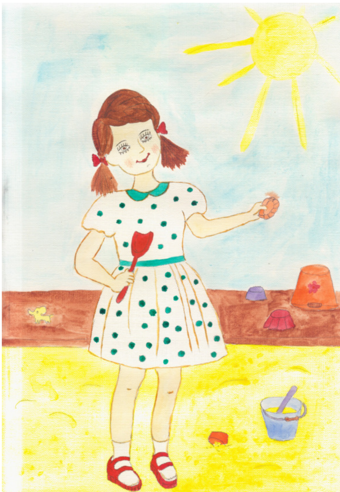
иллюстрация Писанской Ирины (идея взята из сети интернет)