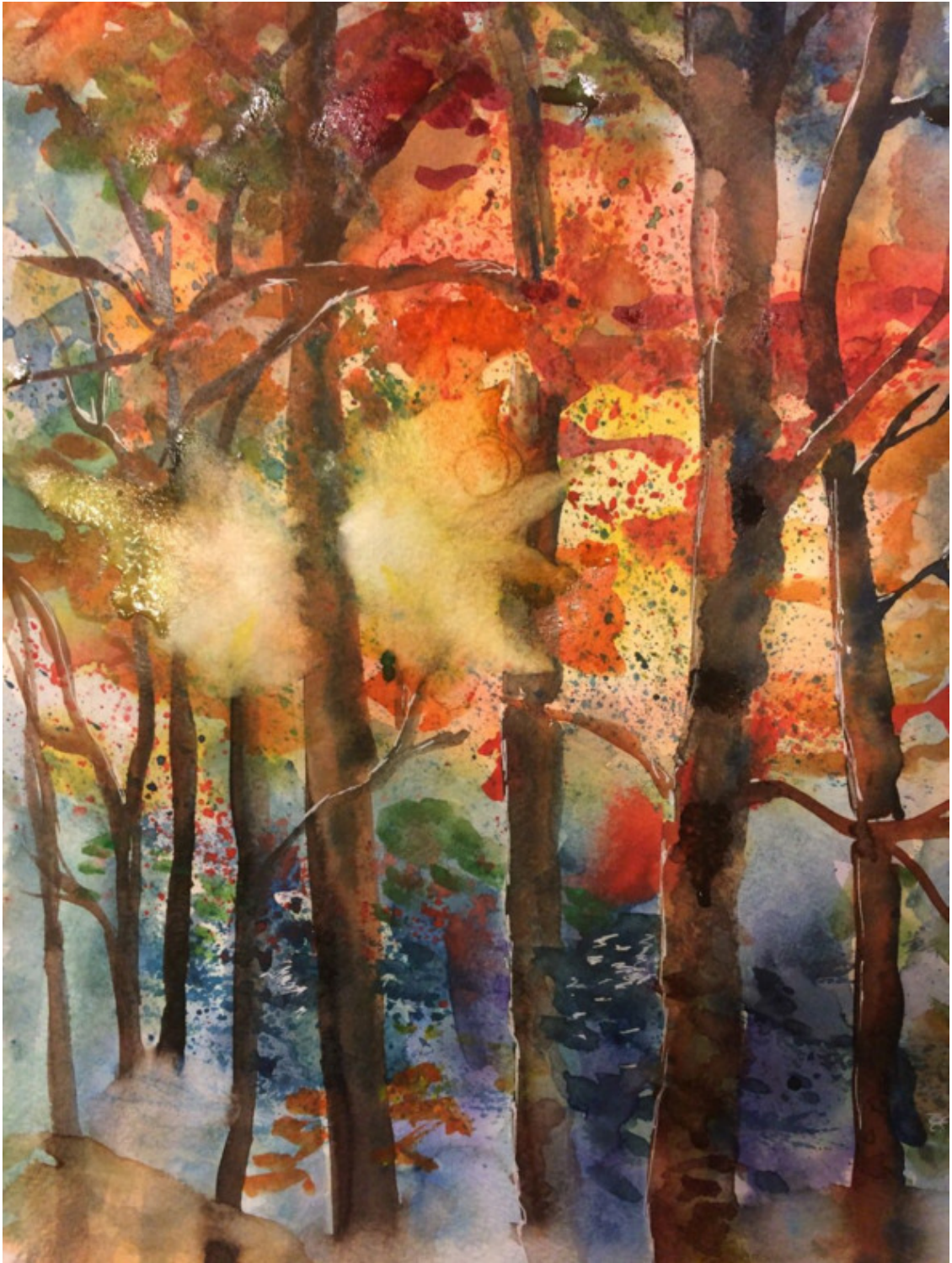
иллюстрация Лукьяновой Елены