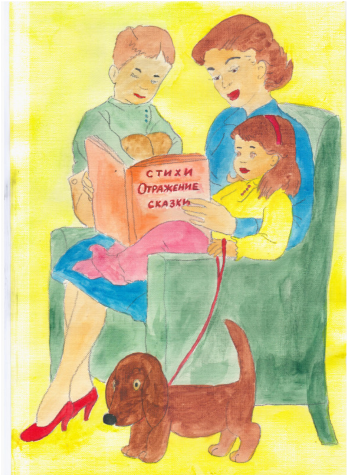
иллюстрация Писанской Ирины (идея взята из сети интернет)

Винни Пух и поросёнок По прозванию Пятачок Вместе весело играют, Мишка песенки поёт!