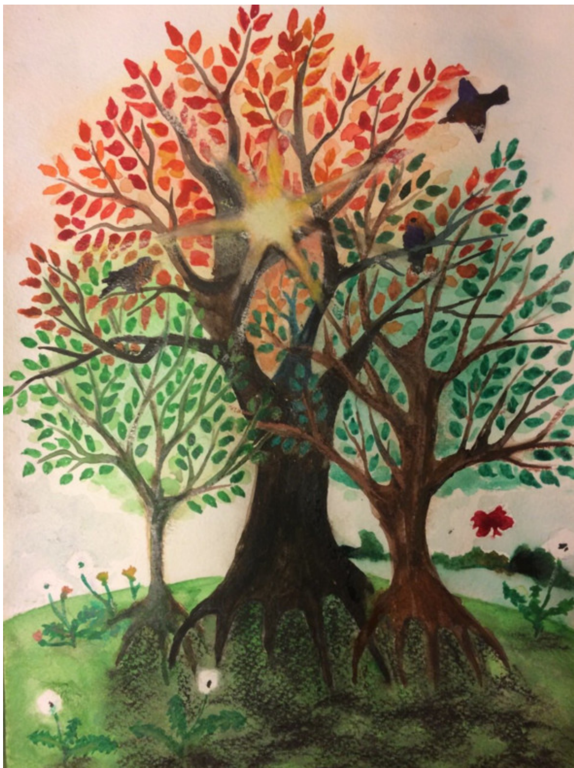
иллюстрация Лукьяновой Елены