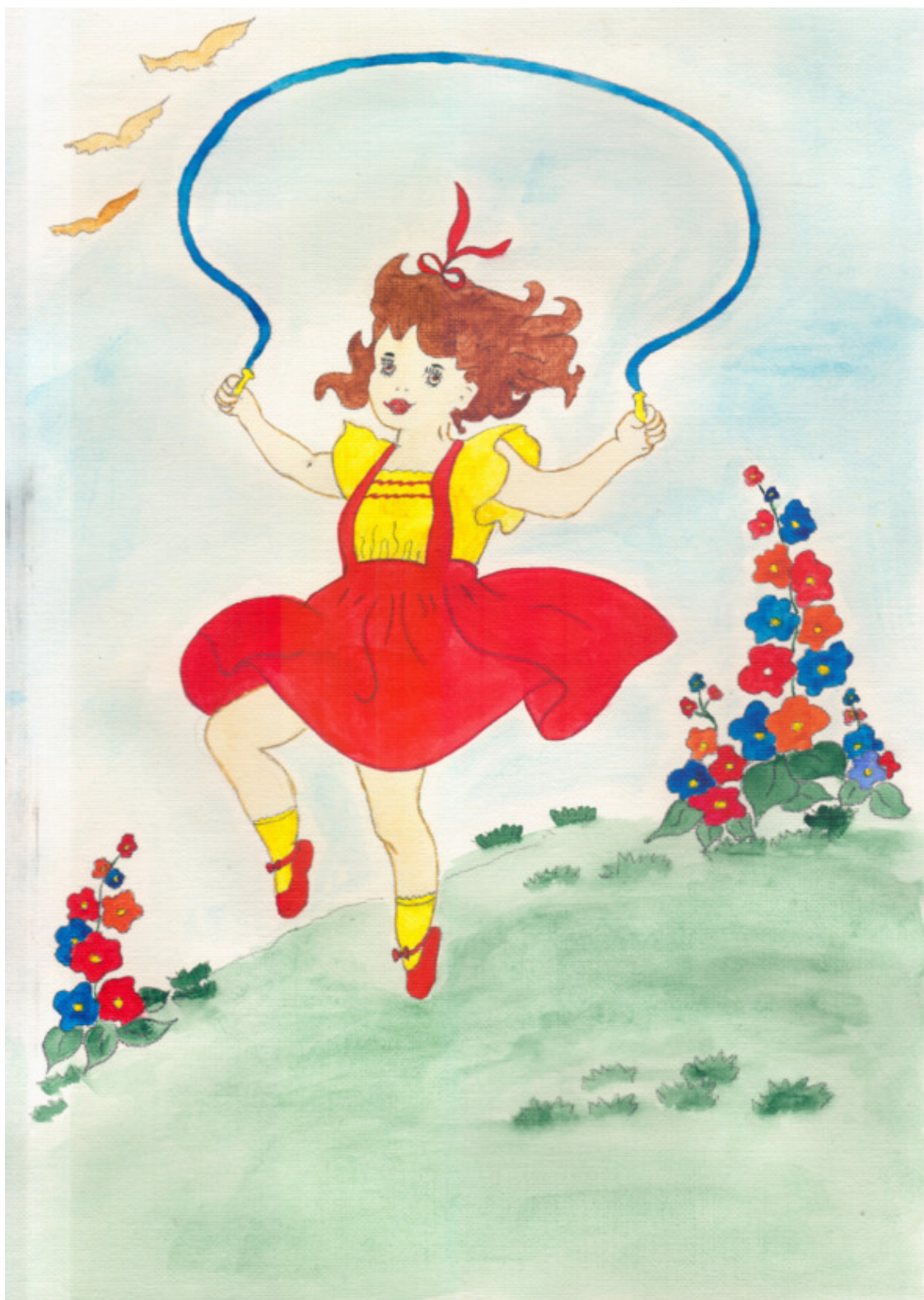
иллюстрация Писанской Ирины (идея взята из сети интернет)