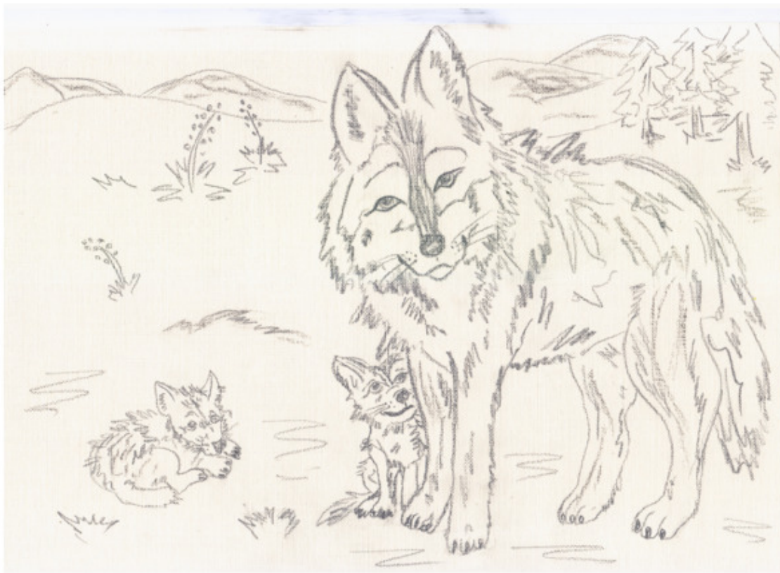
иллюстрация Писанской Ирины (идея взята из сети интернет)

Смотрят волки – малыши, Узнают, кто их враги, Как охотиться в лесу, Обхитрить как им лису.