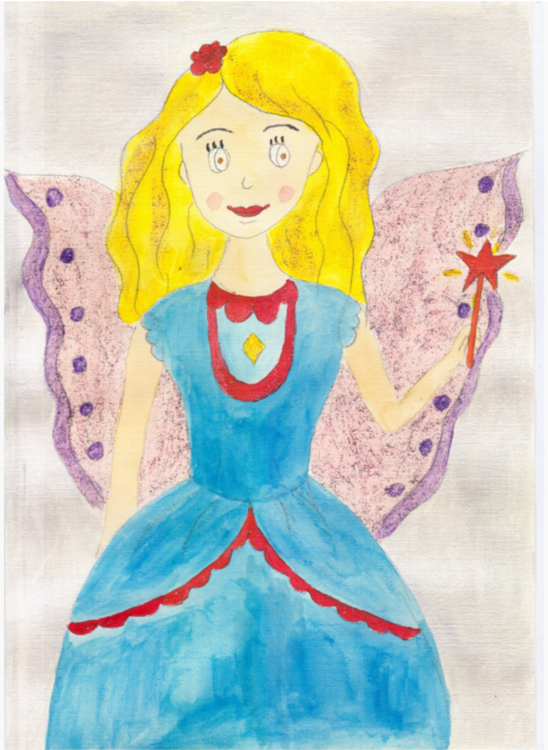
иллюстрация Писанской Ирины (идея взята из сети интернет)

Вот так кукла! Вот так чудо! Ты – волшебница моя! Буду я играть с тобою, Буду верить в чудеса!