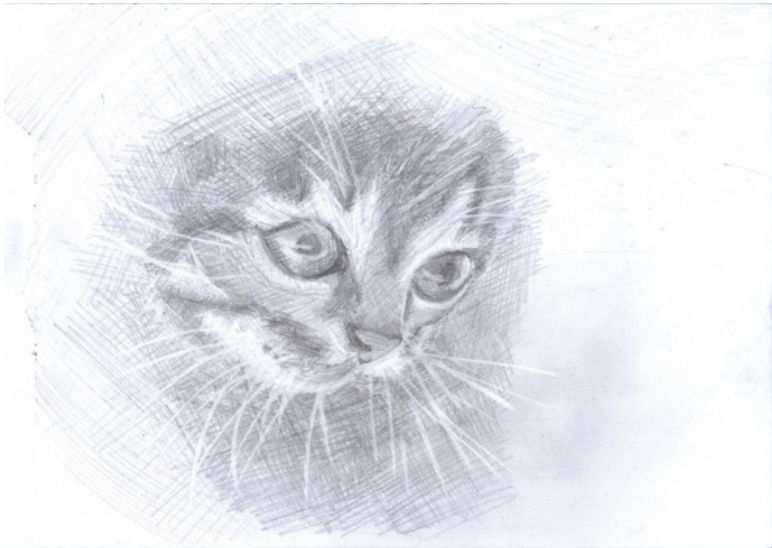
иллюстрация Лукьяновой Елены