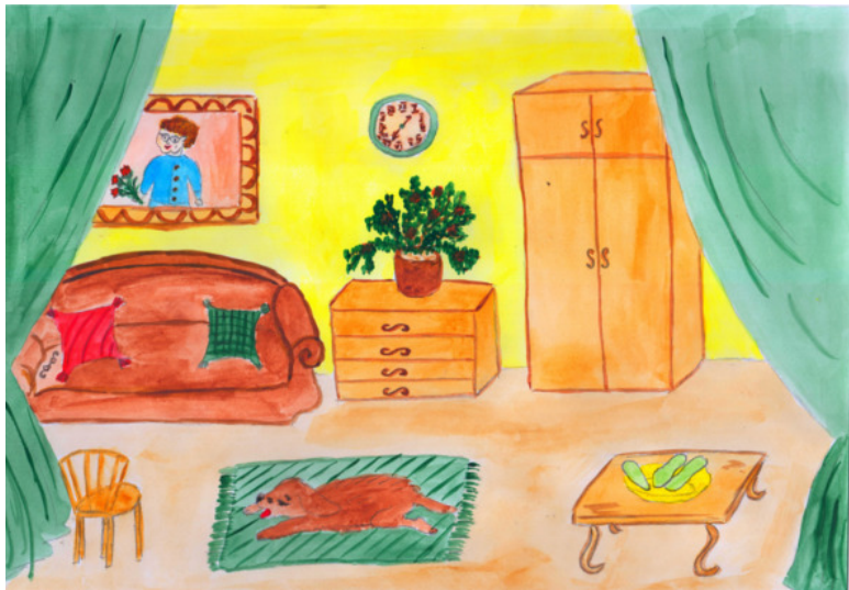
иллюстрация Писанской Ирины