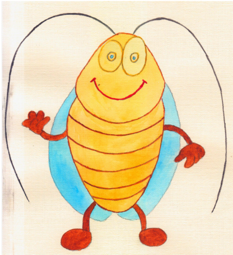
иллюстрация Писанской Ирины (идея взята из сети интернет)