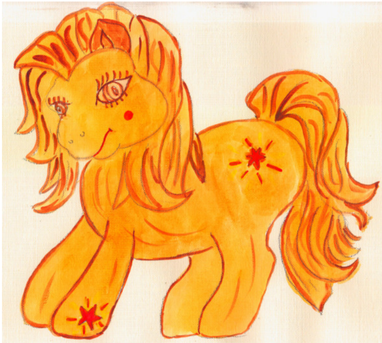
иллюстрация Писанской Ирины (идея взята из сети интернет)