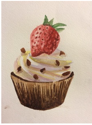
иллюстрация Лукьяновой Елены