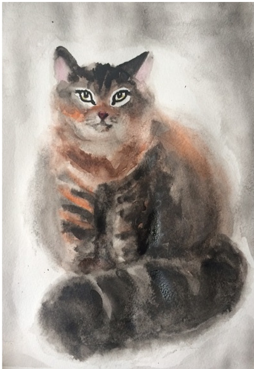
иллюстрация Лукьяновой Елены

«Так, пойдём скорее, киска, Молока тебе налью, Есть сметана и сосиска, Ну? Пойдём! Тебя я жду!»