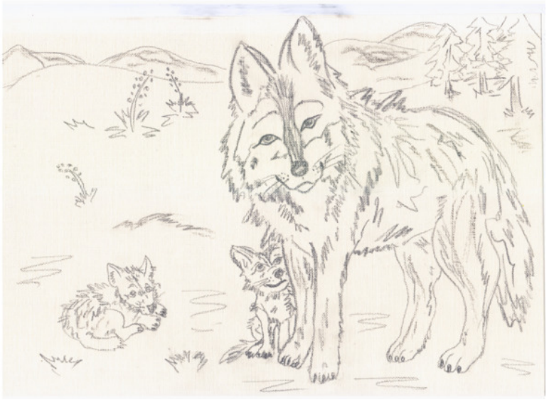
иллюстрация Писанской Ирины (идея взята из сети интернет)

Почулись мастерству И давай все выть: «У-уу!»