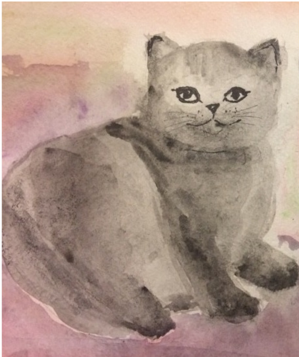
иллюстрация Лукьяновой Елены