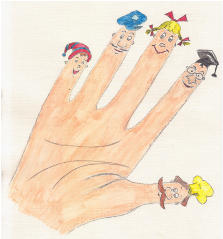
иллюстрация Писанской Ирины (идея взята из сети интернет)