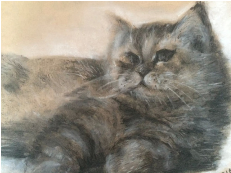
иллюстрация Лукьяновой Елены