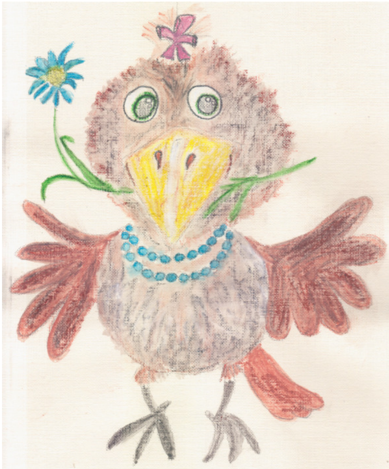
иллюстрация Писанской Ирины (идея взята из сети интернет)