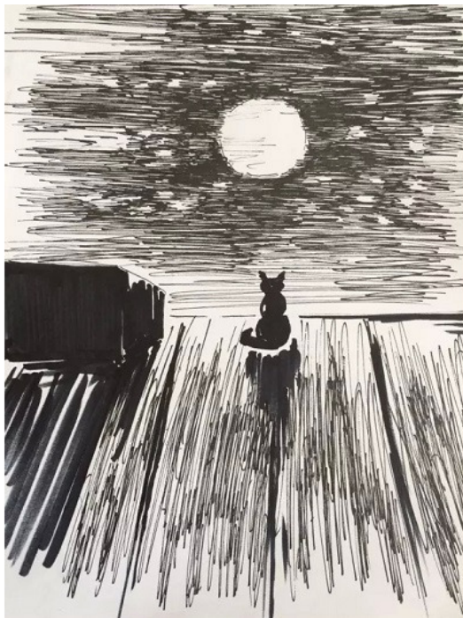
иллюстрация Лукьяновой Елены