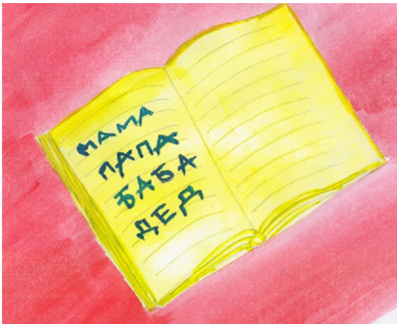
иллюстрация Писанской Ирины