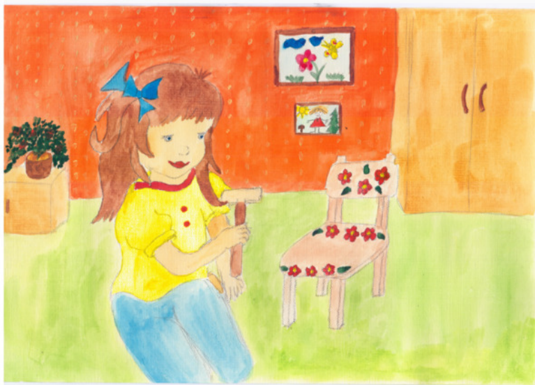
иллюстрация Писанской Ирины (идея взята из сети интернет)

Я – столяр, и у меня Куча дел, как никогда! Мы с енотом – подмастерья И скучать нам некогда!