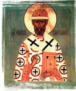
Святитель Филипп Колычев

Фигура Фёдора (Филиппа) Колычева – соловецкого игумена, митрополита Московского – не раз привлекала внимание исследователей.