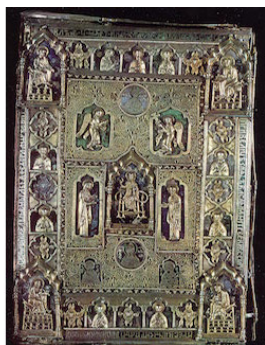
Евангелие Фёдора Кошки