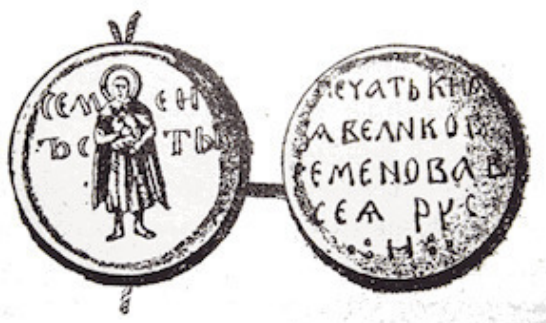
Печать Семёна Гордого