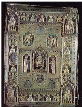
Евангелие Фёдора Кошки

Его сыновья Фёдор Кошка (сын) Кобылин (родоначальник ветви Кошка – Захарьины – Романовы) и Андрей Ёлка (сын) Кобылин (родоначальник ветви Колычевых) становятся видными деятелями при дворе Великих князей. И Александр Ёлка, и Фёдор Кошка были в числе бояр, подписавших вторую духовную грамоту Дмитрия Донского. Федор Кошка в 1380 году, во время Куликовской битвы, возможно, был назначен «комендантом Москвы», что показывает высокую степень доверия к роду Кобылиных.