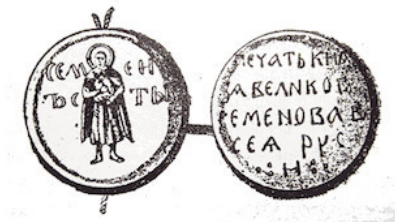
Печать Семёна Гордого