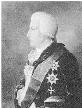
Степан Алексеевич Колычев

В 1722 году один из потомков Андрея Кобылы, Степан Алексеевич Колычев, стольник и первый герольдмейстер Российской империи, составил записку «...о выезде Андрея Ивановича Кобылы в Россию из немец».