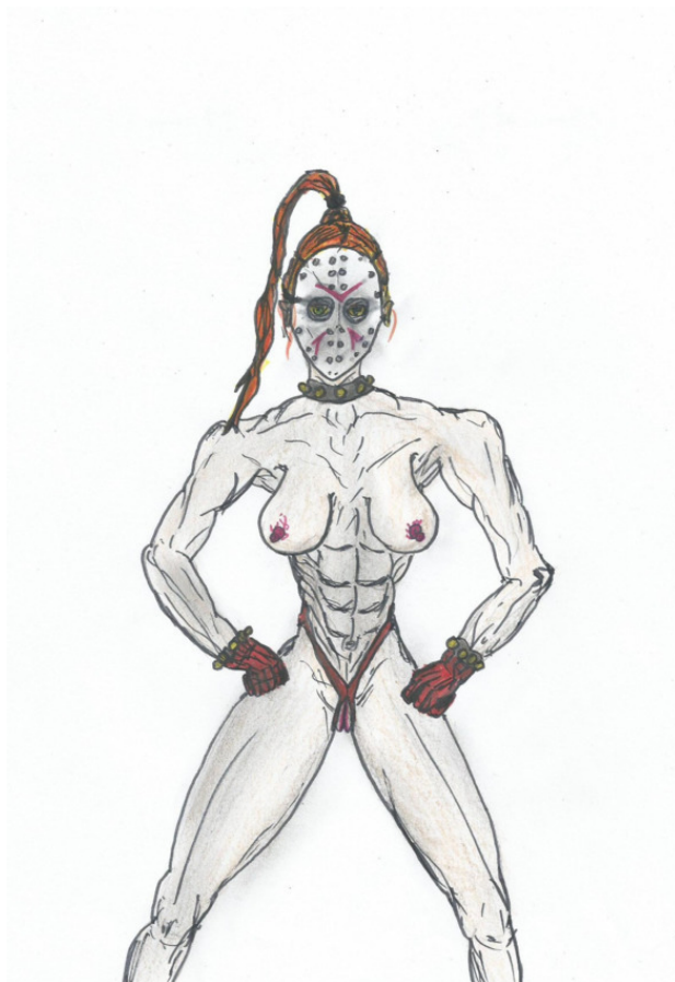
Крутая <SEXY> Женщина-Воин в Хоккейной Маске