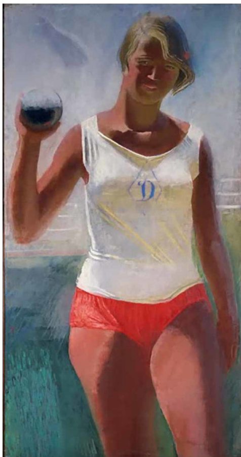
Девушка с ядром. Худ. Самохвалов

– Вот какие кадры у нас за «Динамо» выступают! Прямо как на картине Самохвалова.