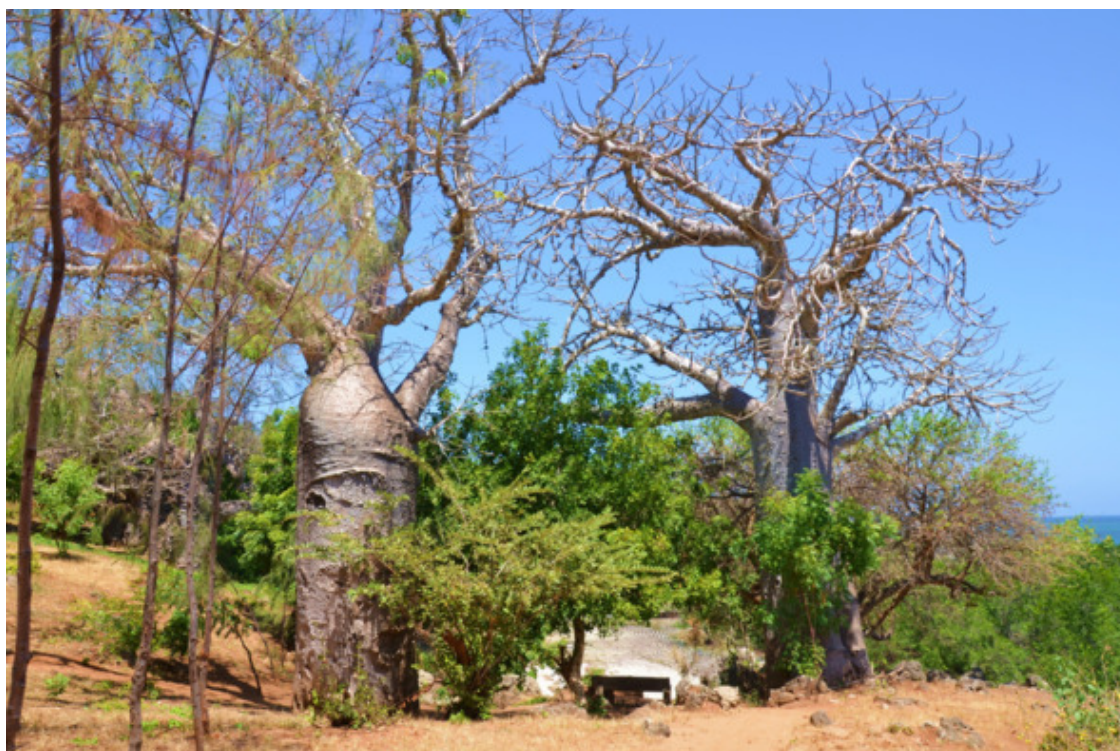
Баобабовый лес на побережье Индийского океана

Основное население Момбасы – мусульманское, это и не удивительно, всё побережье Восточной Африки исповедует ислам. Но женщины здесь носят хиджабы, что, впрочем, присуще Момбасе, другие регионы Кении таким чёрным женским костюмом не увлекаются. Интересным показалось то, что индусы являются немаловажной прослойкой населения. Они занимают многие ниши в сфере бизнеса, торговли, сервиса. По свободным дням индусы приходили к нам в бар при отеле, имея в друзьях нашего гостеприимного менеджера. Мужчины пили пиво и ром, наслаждаясь уединённым местом.