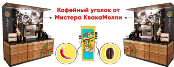
Стойка кофе бара с музыкальными аксессуарами для сотрудников и клиентов магазина.

Мы предлагаем уникальные условия для уже действующих магазинов и кофеен. От фирменной стойки «Мистер КвакаМолли» с кофе и музыкальными аксессуарами для сотрудников и клиентов магазинов, таким образом, вы можете сохранить свое имя и уникальность бизнеса, до полного ребрендинга и смены формата – такой путь подойдет тем, кто хочет кардинально изменить весь свой бизнес.