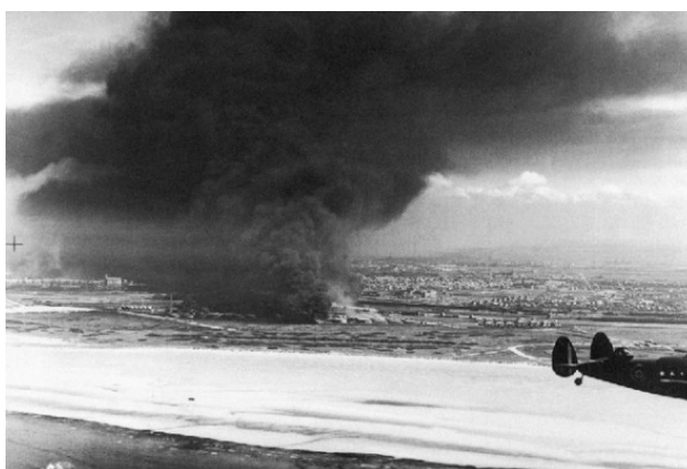
Горящие нефтехранилища Дюнкерка. Справа – патрульный британский самолет

В войну на стороне Германии вступает Италия; хотя ее трехсоттысячная армия не имеет особого успеха, это окончательно деморализует французов, и, 21 июня, в Компьенском лесу, там же, где 20 лет назад был подписан Версальский договор, объявляется о капитуляции Франции. Потери Бельгии: 6000 человек безвозвратно, 202 000 пленных, а также 112 самолетов, Франции 84 000 убитыми, 1,8 млн. пленных (большинство направляются на принудительные работы в Германию), 50 самолетов. Великобритания – 68 000 человек, около 1000 самолетов, 64 000 единиц транспортных средств, Германия – 18000 солдат и офицеров по немецким данным и 45 000 по подсчетам английских историков, 432 самолета. Помимо развитой французской экономики, Германия получает 2000 боеспособных танков (использовались против партизан или переоборудовались в САУ), 1400 самолетов и семитысячный французский добровольческий легион. Фотография – спасенные британские «Томми» движутся к берегам Туманного Альбиона, пролив Па-де-Кале, июнь 1940 г