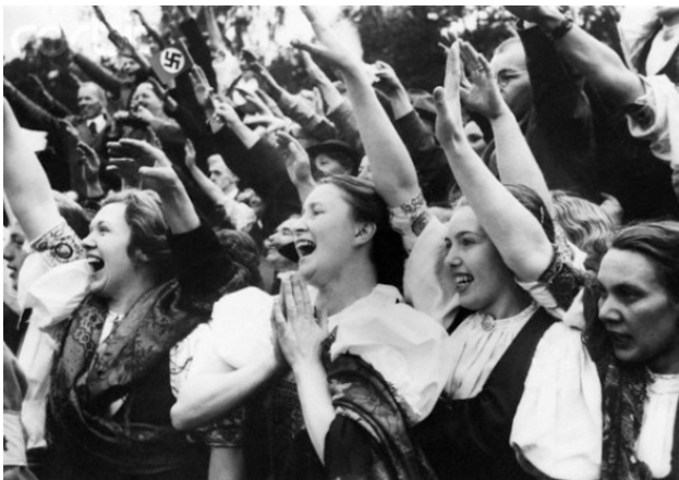
Этнические немцы экс-Чехословакии в национальных костюмах встречают германские войска