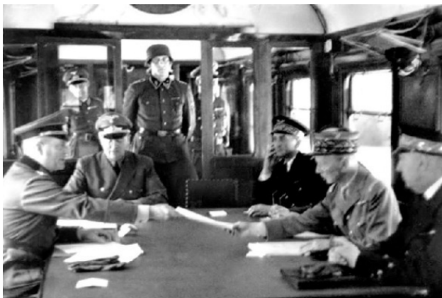
Вагон в Компьенском лесу (Франция), тот самый, в котором 22 года назад подписан унизительный для Германии,