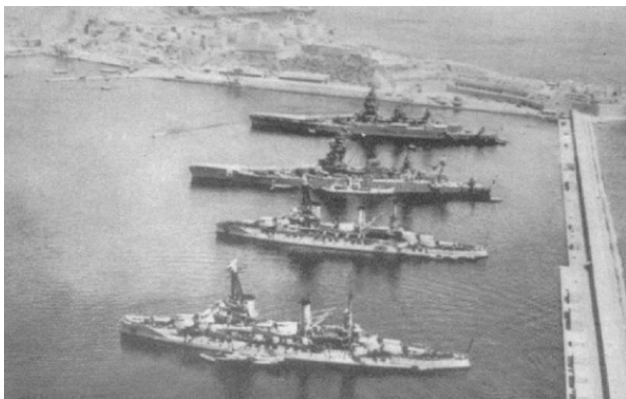
В ночь на 3 июля 1940 г. английские подразделения за-