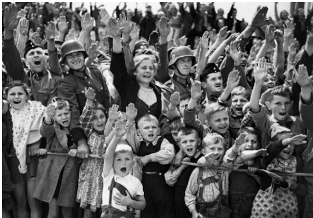
Немецкие дети и солдаты приветствуют успех нацистской Германии, 1940 г.