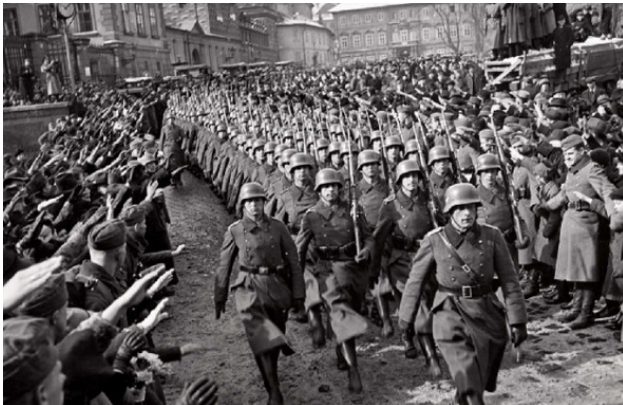
Парад немецко-фашистских войск в Праге, 1939 г.