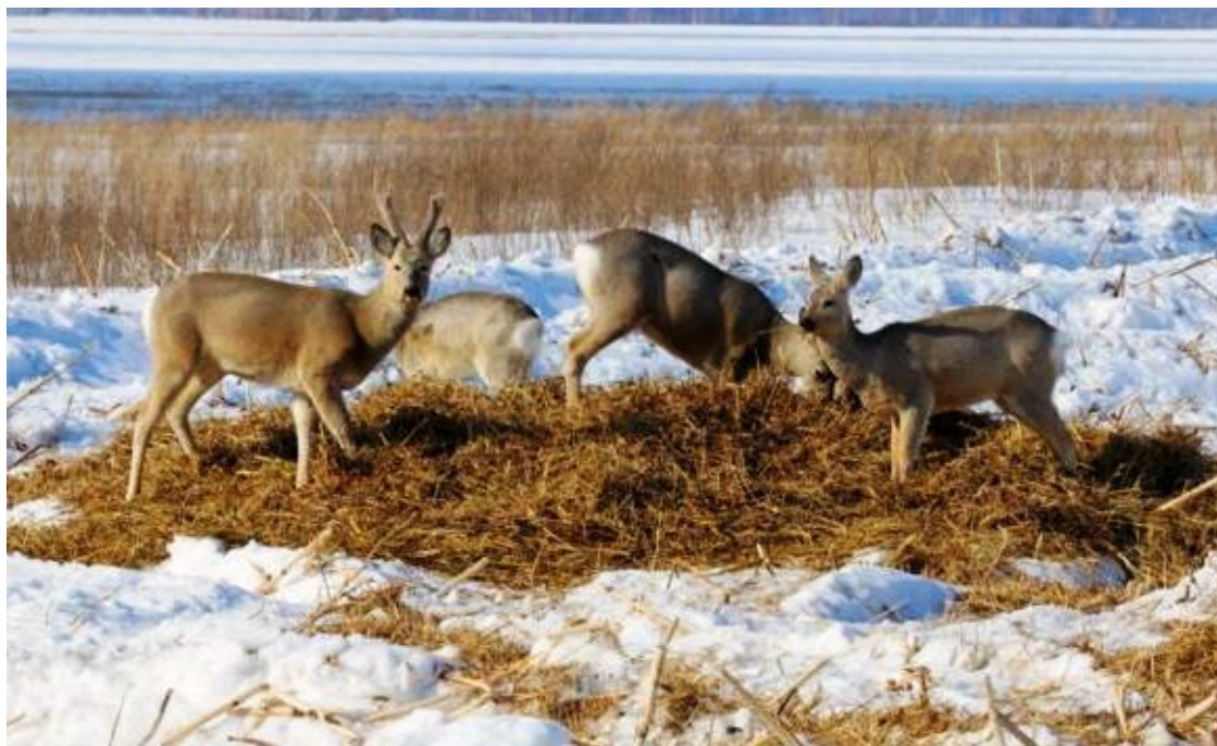
Рис. 7. Косули доедают сено, заготовленное работниками заказника

Что и говорить, зимовка для диких копытных 2006–2007 годов выдалась тяжелой. Со своей стороны, егеря, не имея никаких средств для проведения биотехнических мероприятий, делали все возможное. В частности, неоднократно выезжали в течение зимы проводить подпил осины. Ее ветви с почками у самой кроны прекрасный, богатый витаминами корм для косули.