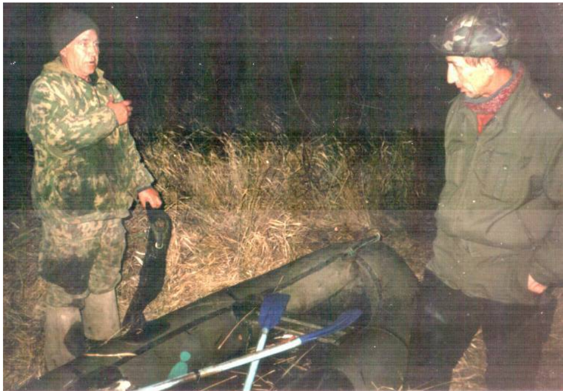
Рис.6. Задержан ночной «гость».