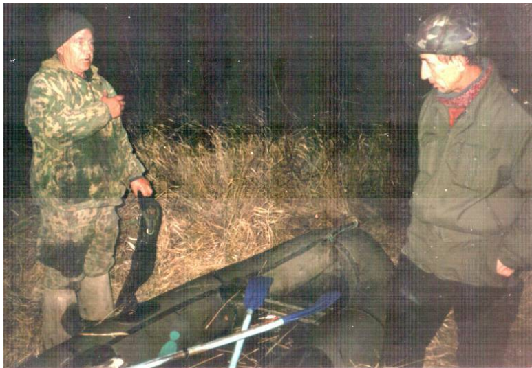
Рис.6. Задержан ночной «гость».