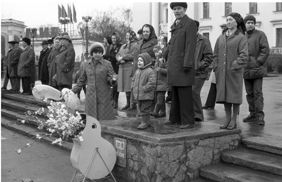
Ил. 2. Владимир Соколаев. «Цветы, птенец и зрители. Площадь Ленина в Первомай. Новокузнецк». 1983

Пожалуй, кульминацией и своего рода пределом пропагандистского симбиоза пространства и текста становится ритуал, принятый на ежегодных авиационных парадах, – над Тушинским аэродромом появляется составленное из нескольких десятков самолетов имя Сталина. Принцип единства содержания и формы воплощается тут в такой полноте, что сложно отличить одно от другого («Слово „Сталин“ могло составлять в небе только из „сталинских соколов“» (Там же)); эти начертанные на небе письма не случайны, не окказиональны, их символическое значение настолько велико, что они присваиваются небу «навечно» – небо тоже включается в состав городских поверхностей, в трехмерной монументальной книге не остается чистых, неисписанных страниц, ни одного свободного «носителя».