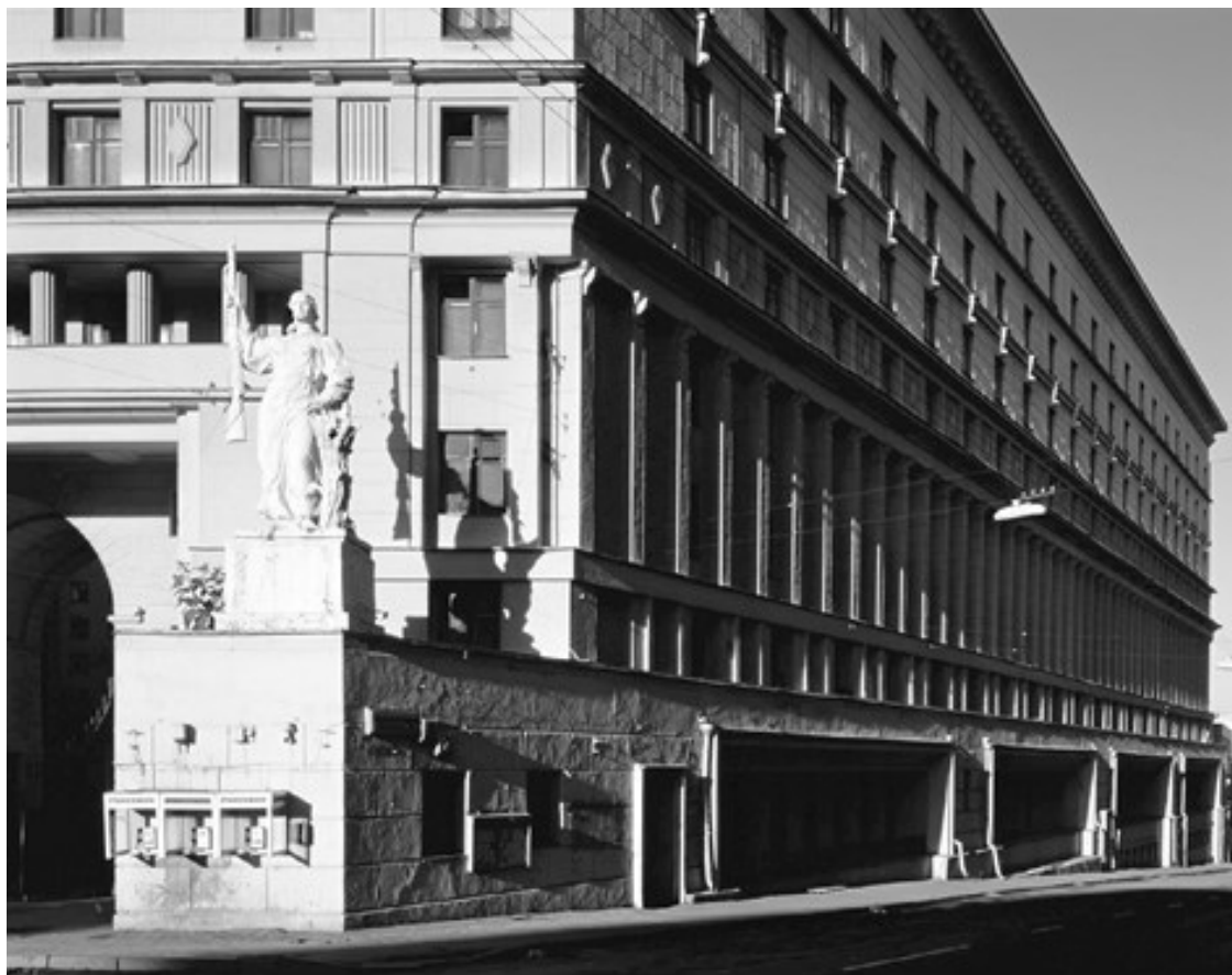
Ил. 10. Игорь Пальмин. «Здание на Яузском бульваре». 1989–1990

«Пустотность» – еще одно важное для Марена слово, позволяющее ему описывать устройство утопического текста и утопического пространства и помогающее нам чуть ближе подойти к ответу на вопрос об устройстве утопического взгляда. Конечно, такой взгляд в значительной мере настроен на различие «пустых» территорий – он фиксирует отсутствие тесноты, захламленности, любой визуальной избыточности (а избыточным, как мы помним, здесь будет считаться «нефункциональное» или, что в данном случае то же самое, «непонятное», то есть не поддающееся семиотическому контролю). Марена, безусловно, завораживает образ утопии как белого пятна, незаполненного пролома в плотной конструкции социальной реальности, таинственной брешки забвения, однако присутствие пустотных пространств в утопическом визуальном каноне можно описать и как своего рода семиотическую анемию, связанную с той блокировкой каналов смыслообразования и смыслопередачи, о которой уже говорилось, – с вытеснением семиотических шумов.