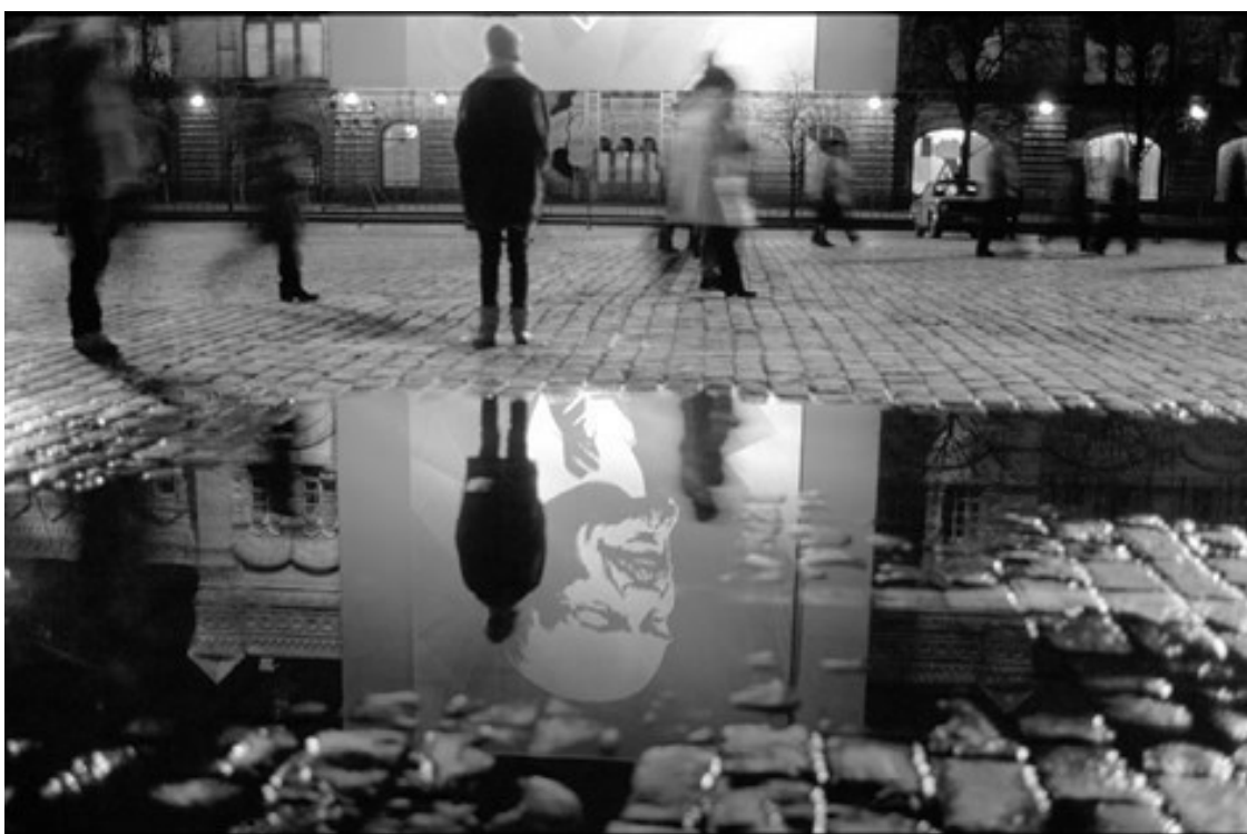
Ил. 8. Игорь Гаврилов. «Сбылось». 1990

Отраженное, автореферентное и окончательно утратившее реальность пространство монументальной пропаганды попадает в кадр Игоря Гаврилова, сделанный в самом конце