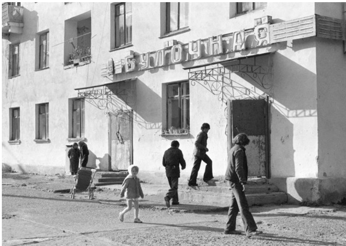
Ил. 9. Игорь Пальмин. «Закаменск, Бурятия». 1980

Такого рода «странное пространство» – возможно, сновидческое, возможно, утопическое – мы видим на фотографии Игоря Пальмина (ил. 9): контрастное освещение, длинные тени и похожие на тени силуэты людей, расходящиеся в центробежном движении, тревожащий взгляд девочки, устремленный в камеру, и общее ощущение пустотности, незавершенности воспоминания – как будто был восстановлен лишь общий контур картины, а частные детали оказались забыты.