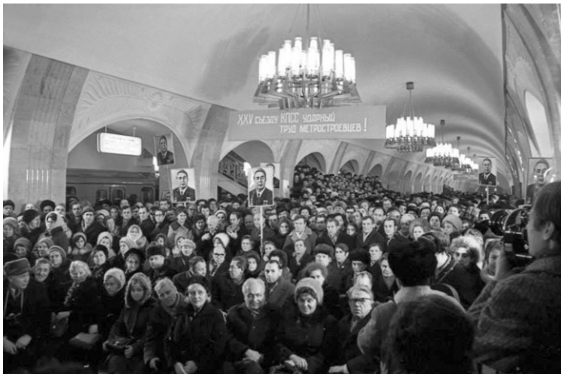
Ил. 11. Дмитрий Воздвиженский, Нина Свиридова. «Открытие станции Пушкинская», цикл «Время иллюзий». 1975