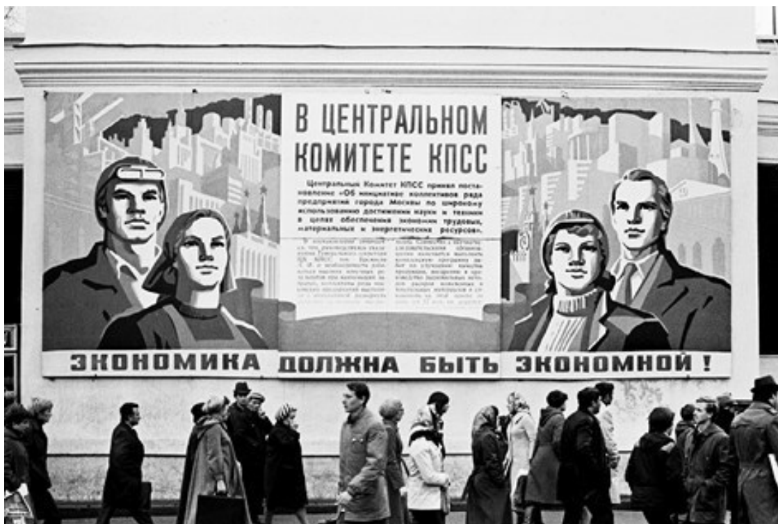
Ил. 4. Игорь Пальмин. «Москва. Площадь Свердлова». 1981