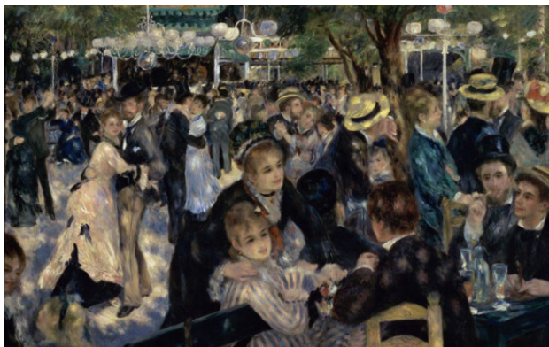
Пьер-Огюст Ренуар. «Мулен де ля Галетт»

(Из досье Интерпола: Пьер-Огюст Ренуар, «Мулен де ля Галетт», 1876 год. Холст, масло. 78 x 114 см. Частная коллекция в Европе. Оценивается в сумму 75—100 млн. долларов).