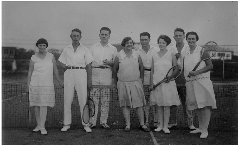
Группа теннисистов на корте в г. Мунго (Суринам). 1929–1930. Groepsportret op de tennisbaan van Moengo, anonymous, 1929–1930. Purchased with the support of the Maria Adriana Aalders Fonds/Rijksmuseum Fonds